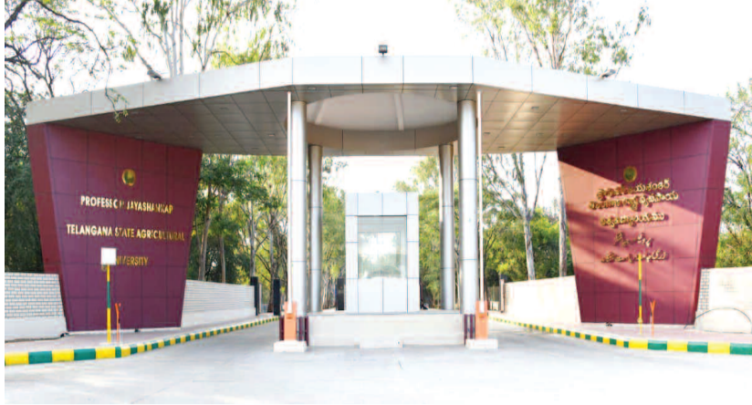
వ్యవసాయ విశ్వవిద్యాలయం ప్రధాన ద్వారం