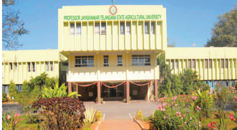
వ్యవసాయ విశ్వవిద్యాలయం పరిపాలన భవనం