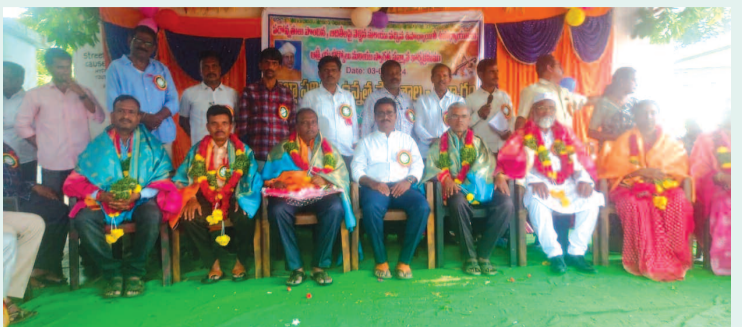
బదిలీ అయిన ఉపాధ్యాయులను సన్మానిస్తున్న గ్రామస్థులు

వినలేదన్నారు. వాళ్లు సభను కారు.. మర్యాదను వదిలేశారంటూ వ్యాఖ్యలు చేశారు. వివక్షలు రాజ్యాంగాన్ని అవమానించాయన్నారు. తనకు కారు, వాళ్లు దేశ ప్రజలకు వెన్ను చూపారని.. రాజ్యాంగానికి ఇంతకంటే ఘోర అవమానం ఉండదన్నారు. వివక్షం అత్యధికమర్చు చేసుకుంటుందని భావిస్తున్నారని ధన్వంట్ అన్నారు. ఈ క్రమంలో రాజ్యసభ నుండి బుధవారం ప్రతిపక్షాలు వాకౌట్ చేశాయి. ప్రస్తుత సమస్యలపై చర్చ జరపాలన్న ప్రతిపక్షాల నినాదాలను వట్టిచుక్కలకంటే రాష్ట్రపతి ప్రసంగంపై ధన్వంట్ తీర్మానంపై ప్రధాని విమర్శలు గుప్పించారు. ఈ వ్యక్తులు అటోపైలెట్, రిపబ్లిక్ పైలెట్లతో ప్రభుత్వాన్ని నడవడానికి అలవాటు పడ్డారు. వారికి వనివీరద సమ్యక్తం లేదు. వేచి చూడటమే వారికి తెలుసు అంటూ గత మనమోహన్ సింగ్ ప్రభుత్వాన్ని విమర్శించారు. ప్రతిపక్షాలు ఆందోళన వ్యక్తం చేస్తూ వాకౌట్ చేశాయి. చైర్మన్ జగదీష్ ధన్వంట్ వారీస్తున్నప్పటికీ.. కాంగ్రెస్ అధ్యక్షుడు మల్లికార్జున్ ఖర్జే సహా పలువురు ప్రతిపక్ష ఎంపీలు వాకౌట్ చేశారు. ప్రతిపక్ష నేత మల్లికార్జున్ ఖర్జేకు అవకాశం ఇవ్వాలని ప్రతిపక్షాలు డిమాండ్ చేశాయి. వివక్షనీడను మాట్లాడేందుకు అనుమతించడం అంటూ నినాదాలు చేశారు. మాట్లాడేందుకు అనుమతించాలని ఖర్జే కూడా వదేవడే అభ్యర్థించారు. తాము తమ అభిప్రాయాలను తెలిపేందుకు అవకాశమివ్వాలని కోరారు. అసత్యాల చెప్పడం ఆవంధి. సిగ్గు పడండి అంటూ పెద్ద పతనం నినాదాలు చేశారు. దీంతో చైర్మన్ సభను నిరవధికంగా వాయిదా వేస్తున్నట్లు ప్రకటించారు.