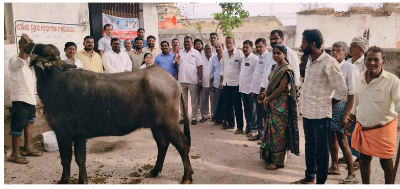
ఉచిత పశువైద్య శిబిరం ను ప్రారంభించిన సర్పంచ్