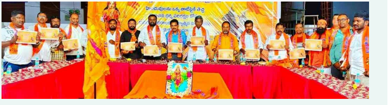
వాల స్పోర్ట్స్ అభివృద్ధి కార్యక్రమంలో పాల్గొన్న హిందూ సమ్మేళనం ప్రతినిధులు