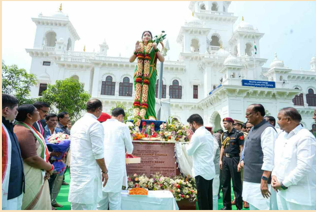
హైదరాబాద్, మార్చి 16 (ప్రభాత ఉదయం)

ఆవిష్కరించిన గవర్నర్ శివ ప్రతాప్ శుక్లా కార్యక్రమంలో పాల్గొన్న రేవంత్, మల్లు భట్టి, పలువురు మంత్రులు ఈ విగ్రహం తెలంగాణ ప్రజల ఆత్మగౌరవానికి నిదర్శనమన్న రేవంత్