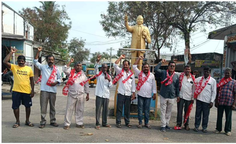
ఆందోళన చేస్తున్న సిపిఐ నాయకులు

పెరిగి...పిచ్చి మొక్కలను ఎప్పటికప్పుడు తొలగించాలని తెలిపారు. నాణ్యముగా ఉన్నాయా లేదా అని వంటకు సరకులను, పప్పు దినుసులను పరిశీలించారు. అలాగే మధ్యాహ్న భోజన తయారీ ని కూడా క్షుణ్ణం గా చూసి జాగ్రత్త గా చేయాలని, ఎప్పటికప్పుడు వంట చేసే ప్రాంతం పరిశుభ్రం గా ఉండాలని, మెనూ ను తప్పకుండా పాటించాలని కలెక్టర్ తెలిపారు. పరీక్షలకు ప్రీపేర్ అవుతున్న 10వ తరగతి విద్యార్థులకు మాథ్స్ సబ్జెక్ట్ లోని పలు అంశాలను కలెక్టర్ స్వయం గా నేర్పించి... వాటి మీద విద్యార్థులకు ఉన్న సామర్థ్యన్ని కూడ పరిశీలించారు.