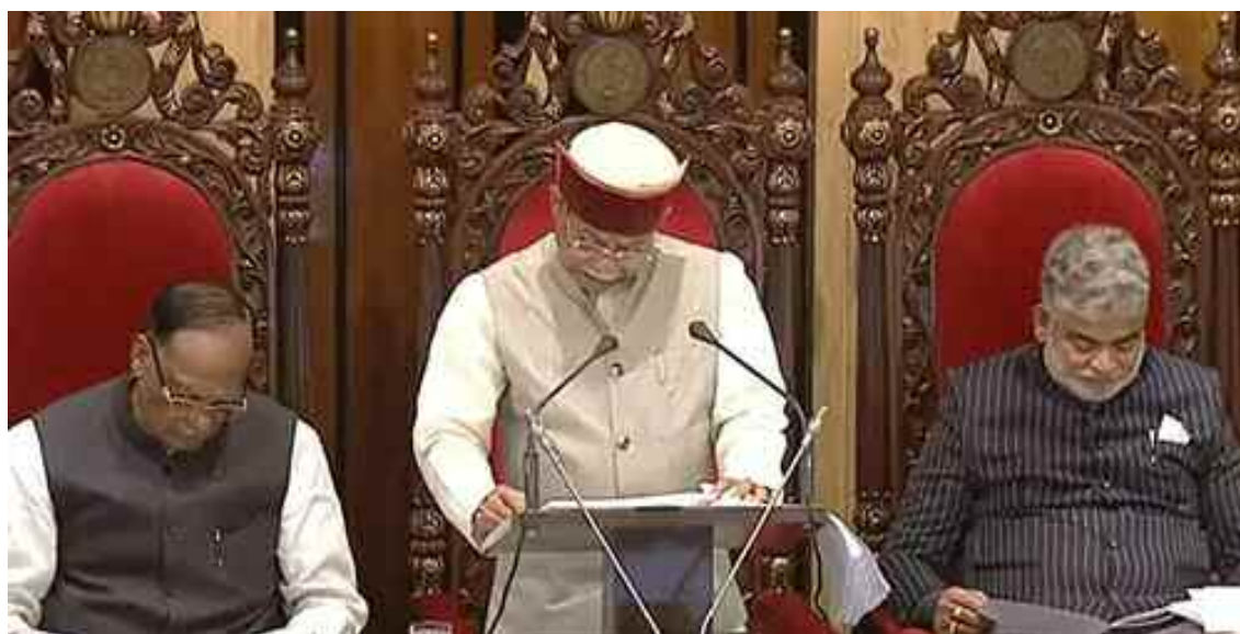
హైదరాబాద్, మార్చి 16 (ప్రభాత ఉదయం)

హైద్రా ద్వారా రూ.60 వేల కోట్ల ప్రభుత్వ ఆస్తులను కాపాడాలి తెలంగాణ రాష్ట్ర గవర్నర్ శివప్రతాప్ శుక్లా అన్నారు. తెలంగాణ అసెంబ్లీ బడ్జెట్ సమావేశాల ప్రారంభం సందర్భంగా ఉభయ సభలను ఉద్దేశించి ఆయన మాట్లాడారు. శ్రమించేతప్పు కలిగిన తెలంగాణ ప్రజలందరికీ శుభాకాంక్షలు అని ఆయన ప్రసంగాన్ని ప్రారంభించారు. ప్రజాకేంద్రీకృత పాలన ప్రభుత్వం విధానమని అన్నారు. విజన్ 2047 ద్వారా 3 ట్రీలియన్ డాలర్ల ఆర్థిక వ్యవస్థకు రోడ్ మ్యాప్ రూపొందించినట్లు తెలిపారు. రాష్ట్ర తలసరి ఆదాయం రూ.4.18 లక్షలకు చేరుకుందని తెలిపారు. క్యూర్, ఫ్యూర్, రేర్ మోడల్ ద్వారా రాష్ట్రాభివృద్ధి కోసం ప్రభుత్వం ప్రణాళికలు