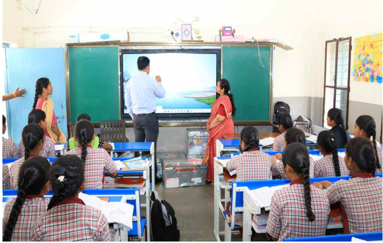
విద్యార్థులకు పాఠాలు చెప్పుతున్న జిల్లా కలెక్టర్