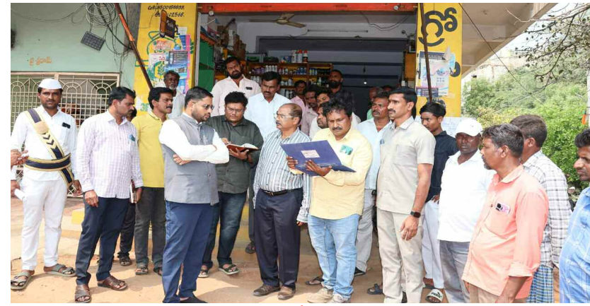
ఫెర్టిలైజర్ దుకాణాన్ని తనిఖీ చేసిన కలెక్టర్ లిజ్జాన్ బాషా షేక్

వైద్య సిబ్బంది ప్రజలకు అందుబాటులో ఉండాలి డిజిటల్ క్రాఫ్ సర్వే ఫార్మర్ లిజ్జాన్ షేక్ పక్కా నిర్వహించాలి గడ్వాల జిల్లా ప్రతినిధి, మార్చి 16 (ప్రభాత ఉదయం)