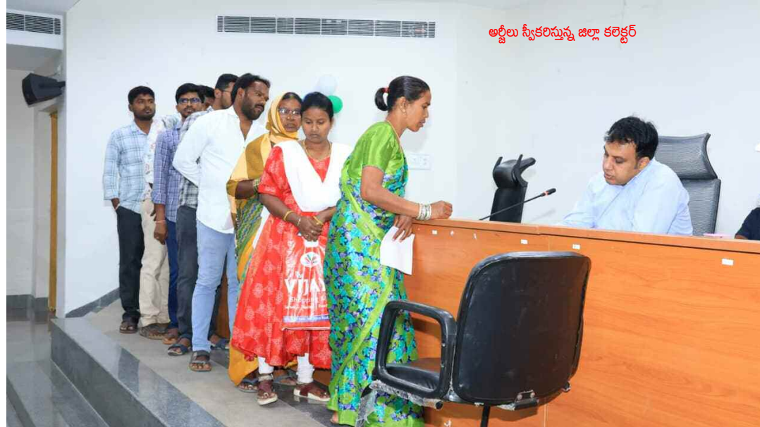
ఆర్థిల స్వీకరణకు జిల్లా కలెక్టర్