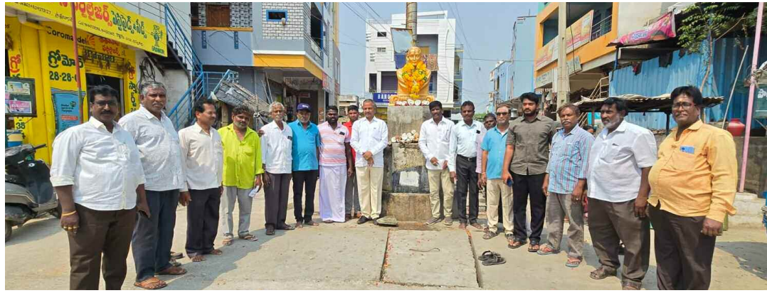
అమరజీవి పాట్ల శ్రీరాములు విగ్రహానికి నివాళులర్పిస్తున్న నాయకులు