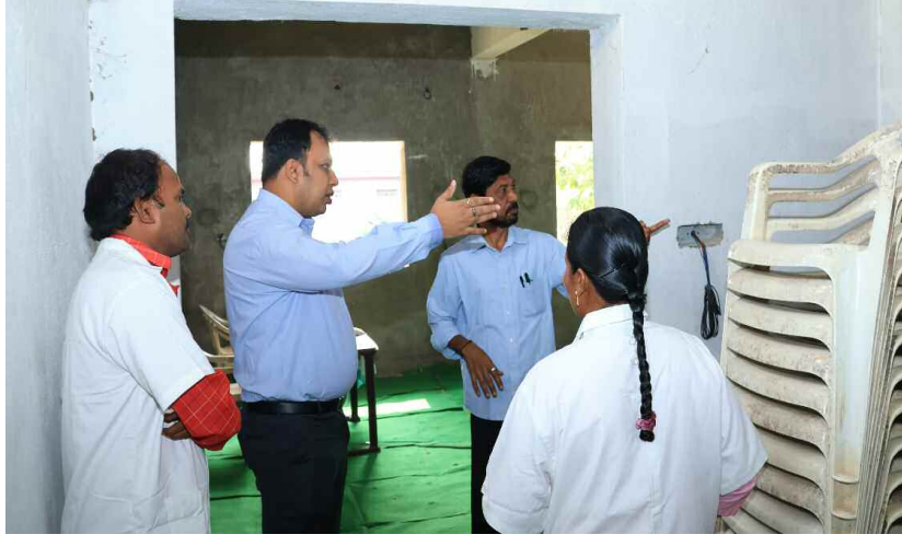
పీహెచ్ సి ను తనిఖీ చేస్తున్న జిల్లా కలెక్టర్