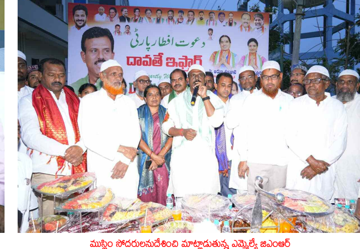
ముస్లిం సోదరులను సేవించి మాట్లాడుతున్న ఎమ్మెల్యే జిఎంఆర్

రంజాన్ పండుగని పురస్కరించుకొని పట్టణంలోని ఖాద్రి మసీదులో ముస్లిం సోదరులతో కలిసి ఎమ్మెల్యే ప్రత్యేక ప్రార్థనలో పాల్గొన్నారు. అనంతరం క్యూ ఆర్ ఫంక్షన్ హాల్ లో రాష్ట్ర ప్రభుత్వం ఏర్పాటు చేసిన రంజాన్ తోఫాను ముస్లిం