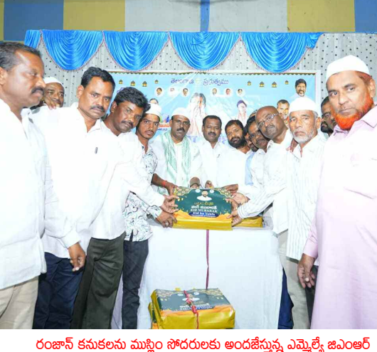
రంజాన్ కనుకలను ముస్లిం సోదరులకు అందజేస్తున్న ఎమ్మెల్యే జిఎంఆర్

రంజాన్ పండుగని పురస్కరించుకొని పట్టణంలోని ఖాద్రి మసీదులో ముస్లిం సోదరులతో కలిసి ఎమ్మెల్యే ప్రత్యేక ప్రార్థనలో పాల్గొన్నారు. అనంతరం క్యూ ఆర్ ఫంక్షన్ హాల్ లో రాష్ట్ర ప్రభుత్వం ఏర్పాటు చేసిన రంజాన్ తోఫాను ముస్లిం