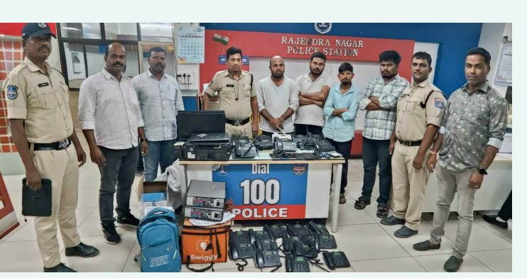
పోలీసుల ఆధ్వర్యంలో నిందితుడు

నేరుగా పనిచేయడం ద్వారా అభ్యుత్సాహాన్ని పెంపొందించుకున్నారు గుర్తు చేశారు. కొత్త సాంకేతికతలను స్వయంగా ప్రయత్నించారన్నారు. ఈ అనుభవం విద్యార్థులలో ఆసక్తి, ఉత్సాహాన్ని పెంచి నేర్చుకునే ప్రక్రియను నడదగా, ప్రయోజనకరంగా మార్చిందని తెలిపారు.