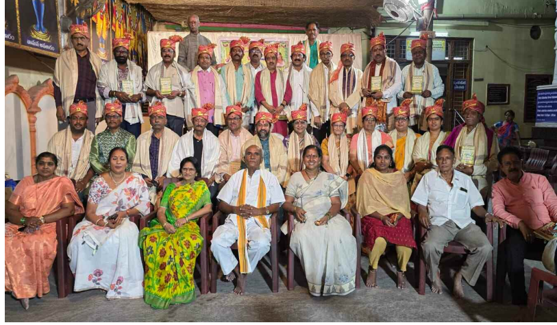
కవి సమ్మేళనానికి హాజరైన కవులు