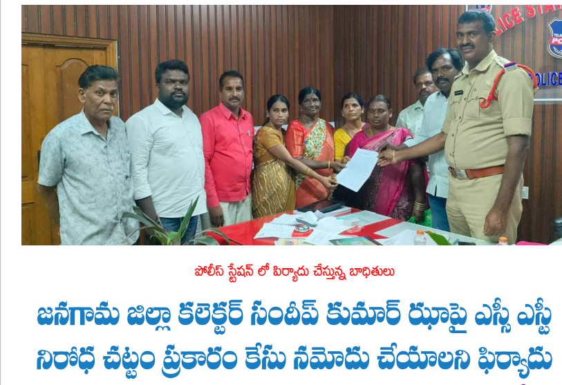
జాతీయ స్టేషన్ లో సిరియస్ చేస్తున్న బాధితులు