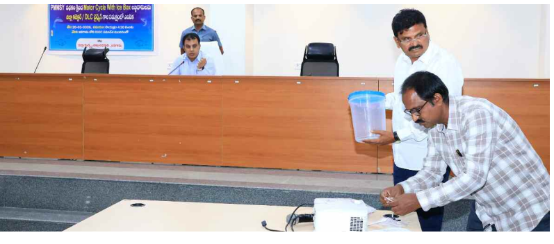
డా. తీర్థన్న అధికారులు

అదనపు నిధులను మంజూరు చేస్తామన్నారు. ఈ సందర్భంగా జిల్లా కలెక్టర్ తరగతి గదిలో విద్యార్థులతో మాట్లాడారు. వారికి అందజేస్తున్న రాజశేఖర్ అహారం, ఇతర సౌకర్యాలపై వాడుక చేశారు. ఏమైనా సమస్యలు ఉంటే విద్యార్థులు తన దృష్టికి తీసుకురావాలని, తప్పకుండా పరిష్కరిస్తామని ఈ సందర్భంగా కలెక్టర్ పేర్కొన్నారు.