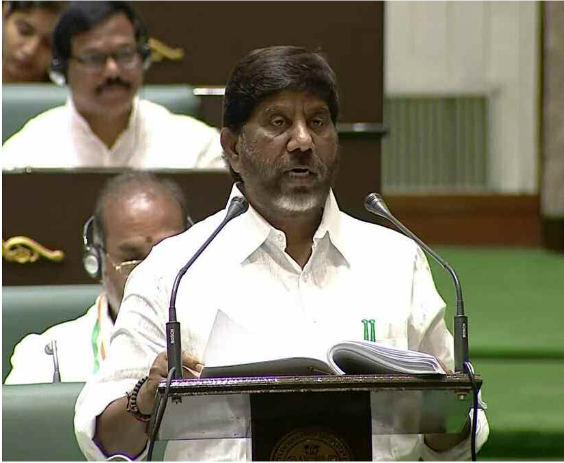
హైదరాబాద్, మార్చి 20 (ప్రభాత ఉదయం) 2

తెలంగాణ ప్రభుత్వం వార్షిక బడ్జెట్ను ప్రవేశపెట్టింది. శాసనసభలో ఉప ముఖ్యమంత్రి భట్టి విక్రమార్కు బడ్జెట్ ప్రవేశపెట్టి ప్రసంగాన్ని ప్రారంభించారు. రూ.3,24,234 కోట్లతో రాష్ట్ర బడ్జెట్ను ప్రవేశపెట్టారు. ప్రతి పౌరుడికి సామాజిక, ఆర్థిక న్యాయం అందించడమే తమ లక్ష్యమని పేర్కొన్నారు. అంబేద్కర్ అడుగు జాడల్లోనే పాలన సాగిస్తున్నట్లు తెలిపారు. అటు శాసనమండలిలో ఉత్తమకుమార్ రెడ్డి బడ్జెట్ను ప్రవేశపెట్టారు.