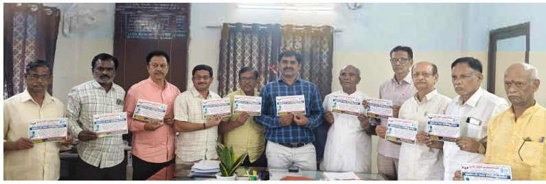
నీటి సంరక్షణ గోడ పత్రక విడుదల చేస్తున్న అసోసియేషన్ సభ్యులు, జలమండలి అధికారులు.