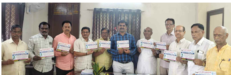
నీటి సంరక్షణ గోడ పత్రిక విడుదల చేస్తున్న అసోసియేషన్ సభ్యులు. జలమండలి అధికారులు.

రంజాన్ మాసం ఉపవాస దీక్షలు ముగిసాయి. శుక్రవారం భారత్ లో నెలవంక కనిపించింది. దీంతో దేశవ్యాప్తంగా ముస్లింలు శనివారం ఈద్-ఉల్-ఫితర్ (రంజాన్) పండుగ జరుపుకుంటారు. వాస్తవానికి శుక్రవారమే రంజాన్ ఉంటుంది. తొలిత అంతా భావించారు. కానీ ముందురోజు నెలవంక కనిపించడంతో ప్రభుత్వం సాధారణ పని దినంగా ప్రకటించింది. అయితే.. వెంటనే పరిస్థితిని పరిశీలించిన ప్రభుత్వం రంజాన్ పండుగను శనివారం జరుపుకోవాలని నిర్ణయించింది. దీనికి అనుగుణంగా శనివారం అధికారికంగా సెలవు ప్రకటనూ ప్రభుత్వం ఉత్తర్వులు జారీ చేసింది. పవిత్ర దివ్య ఖురాన్ అవతరించిన ఈ మాసంలో కఠిన ఉపవాస దీక్షల అనంతరం ఈ వేడుకను జరుపుకోవచ్చునూ ముస్లిం సోదరులు, మనిషిలోని చెడు భావనల్ని అధర్మాన్ని దోషాన్ని రూపుమాపే గొప్ప పండుగ 'ఈద్-ఉల్-ఫితర్' అని ముస్లింలు భావిస్తారు.