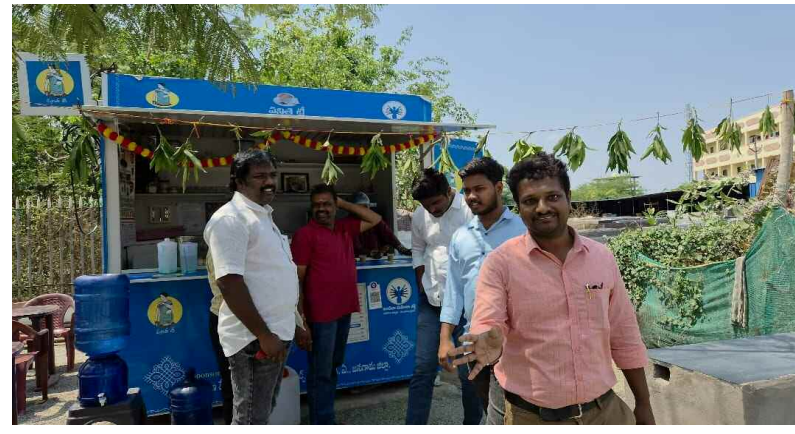
వనత టీ స్టాల్, విజయ మిల్స్ పార్లర్ మహిళలపై