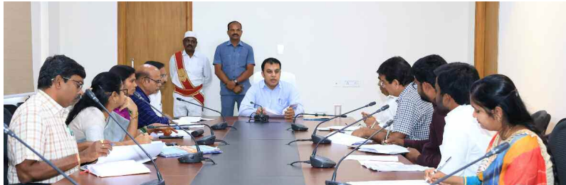
అధికారులతో సమీక్ష చేస్తున్న జిల్లా కలెక్టర్