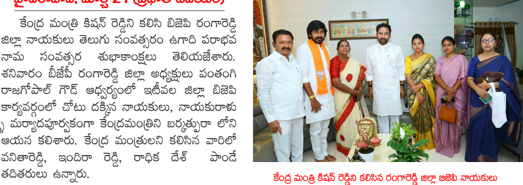
కేంద్ర మంత్రి కిషన్ రెడ్డిని కలిసిన రంగారెడ్డి జిల్లా జనబల నాయకులు