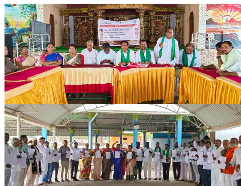
సమావేశంలో అభివృద్ధి నాయకులు