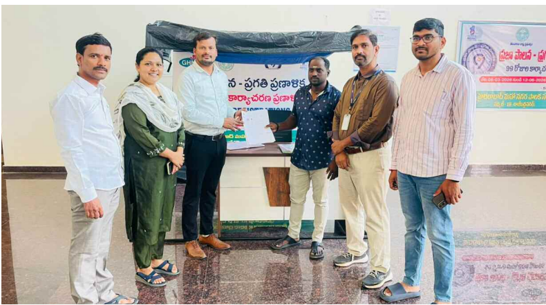
1) వీధి వ్యాపారులకు రిజిస్ట్రేషన్ పత్రాలు అందజేస్తున్న ఆధికారి