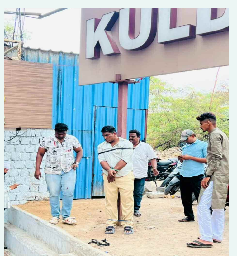
ఆలో దొంగ కు దేహ శుద్ధి