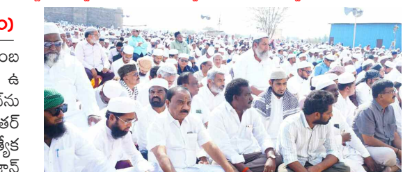
ఈడ్ల వద్ద ప్రార్థనలో పాల్గొన్న తరలివచ్చిన నాయకులు

ముస్లింల పవిత్ర పండుగ రంజాన్ ను జోగళాంబ గద్వాల జిల్లాలో ఘనంగా జరుపుకున్నారు. నెల రోజుల ఉపవాస డీక్షల అనంతరం శనివారం రంజాన్ ను ఆనందోత్సాహంతో జరుపుకున్నారు. ఈడే అల్ ఫిత్ ర్ పర్యవేక్షణ సందర్భంగా మసీదులు, ఈడ్లలో ప్రత్యేక ప్రార్థనలతో వేలాదిమంది ముస్లిం సోదరులు రంజాన్ పండుగ పవిత్రతను చాటి చెప్పారు. రంజాన్ సందర్భంగా గద్వాల పట్టణంలోని ఈడ్ల మైదానంలో సామాజిక ప్రార్థనలకు వేలాది మంది ముస్లింలు తరలివచ్చారు. చిన్నా పెద్దా అన్ని తారతమ్యం లేకుండా కుటుంబ సభ్యులంతా కొత్త బట్టలు ధరించి, భక్తిభావంతో ప్రార్థనలకు వచ్చారు. ఈ