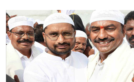
జిల్లా కలెక్టర్ కు రంజాన్ శుభాకాంక్షలు తెలియజేస్తున్న గద్వాల ఎమ్మెల్యే బండ