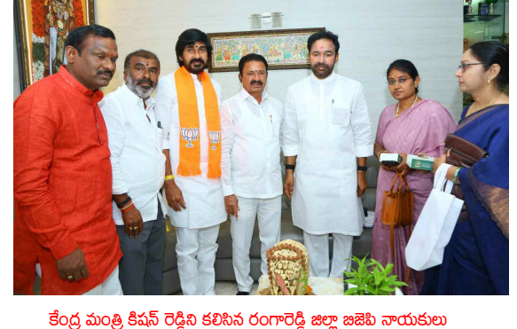
కేంద్ర మంత్రి కిషన్ రెడ్డిని కలిసిన రంగారెడ్డి జిల్లా జనబల నాయకులు