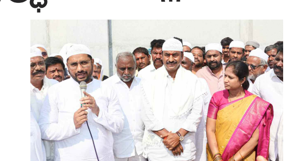
జిల్లా కలెక్టర్ కు రంజాన్ శుభాకాంక్షలు తెలియజేస్తున్న గద్వాల ఎమ్మెల్యే బండ