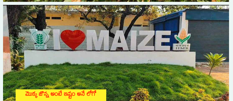
మొక్కజొన్న అంటే ఇష్టం అనే లోగో