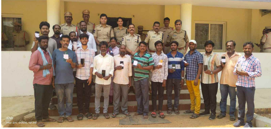
మొబైల్ ఫోన్లు కోల్పోయిన బాధితులకు తిరిగి ఇవ్వడం పోలీసులు

జనగామ జిల్లా ప్రతినధి, మార్చి 24 (ప్రభాత ఉదయం)