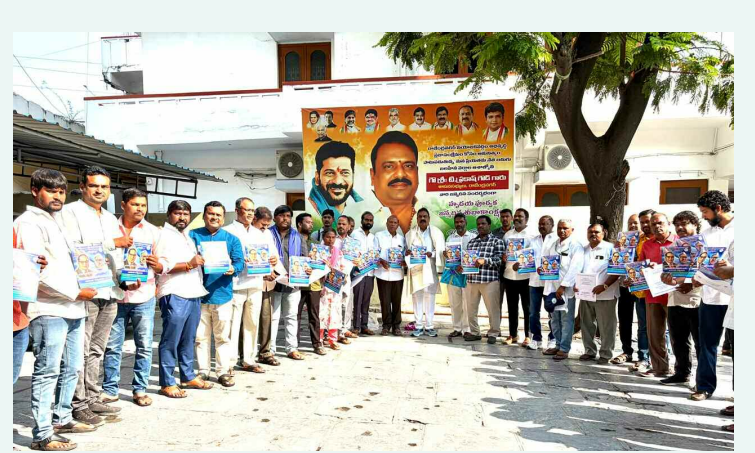
మహనీయుల జయంతి ఉత్సవాల ప్రోచర్ ఆవిష్కరణ