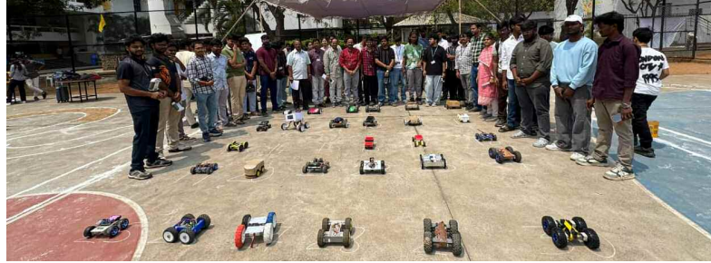
రోబో రేస్ లో పాల్గొన్న విద్యార్థులు

ఉండాలని ఆయన పిలుపునిచ్చారు. కోవిడ్ ను ఎదుర్కొన్న రీతిలో రాబోయే రోజులకు సన్నద్ధంగా ఉండాలన్నారు. ఇవాళ రాజ్యసభలో కూడా మోడీ ఈ అంశాలనే ప్రస్తావించారు. అన్ని వనరుల నుంచి గ్యూస్ ను, క్రూడ్ అయిల్ ను సమీకరించే ప్రయత్నం చేస్తున్నట్లు ప్రధాని మోడీ తెలిపారు. పశ్చిమాసియాలో యుద్ధం వల్ల తీవ్ర ఎన్జీ సంక్షోభం ఏర్పడిందని, ఆ సంక్షోభాన్ని తట్టుకునే రీతిలో ప్రయత్నాలు జరుగుతున్నట్లు వెల్లడించారు. చర్చలు, దౌత్యం ద్వారా శాంతిని నెలకొల్పాలని భావిస్తున్నామన్నారు. యుద్ధ ఉద్రిక్తతలు తగ్గలని, హోర్నుల్ జలసంధిని ఓపెన్ చేయాలని ఆయన కోరారు. శాంతియుతంగా సమస్యను పరిష్కరించుకోవాలన్నారు. ఒకవేళ పశ్చిమాసియా పరిస్థితులు సుదీర్ఘ కాలం కొనసాగితే అప్పుడు పరిస్థితులు భయనకంగా ఉంటాయన్నారు. భారత్ వద్ద ప్రస్తుతం 53 లక్షల మెట్రిక్ టన్నుల రిజర్వ్ ఇంధనం ఉన్నట్లు చెప్పారు. రాబోయే రోజుల్లో ఆ సంఖ్యను 65 లక్షల మెట్రిక్ టన్నులకు చేర్చనున్నట్లు తెలిపారు. ఇంధన నౌకల తయారీ ప్రాజెక్టు కోసం సుమారు 70 వేల కోట్లు కేటాయించినట్లు చెప్పారు.