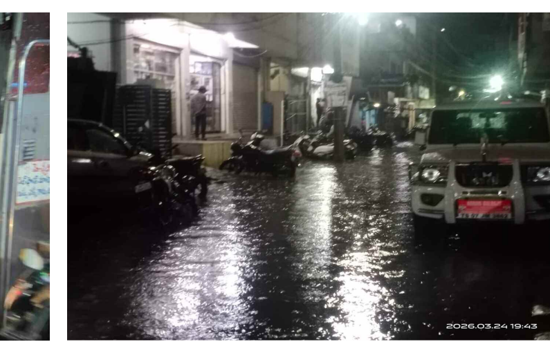
హైదర్ గూడ బాందియా వెనుక వీధిలో చెరువులా మారిన రోడ్డు