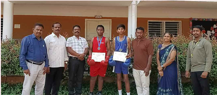
బాక్సింగ్ లో రాష్ట్ర స్థాయి వరకైనా పొందిన విద్యార్థులు