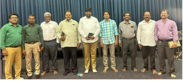
రాజేంద్రనగర్ పాస్టర్స్ ఫెలోషిప్ నూతన కమిటీ సభ్యులు