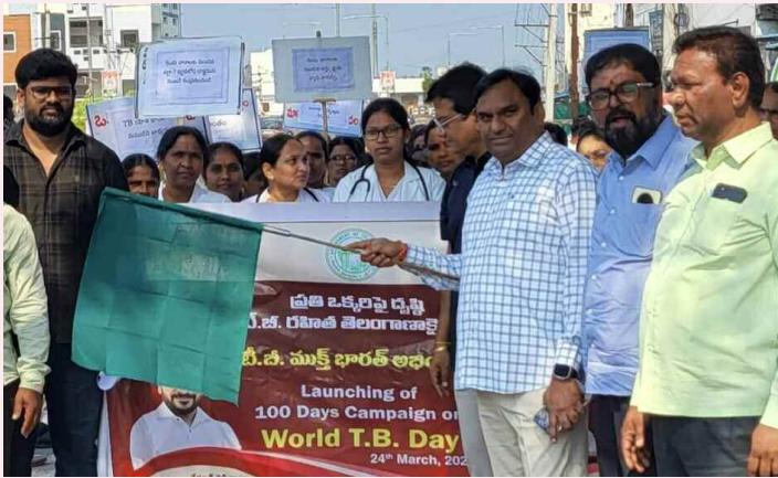
ర్యాలీని ప్రారంభిస్తున్న డిఎమ్ఎస్ఐ