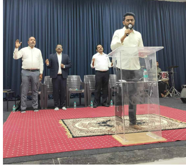
ఆరాధన లో నడిపిస్తున్న రెవరెండ్ దీవెన్