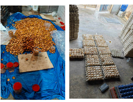
పాడైన కోడి గుడ్లు, కల్లీ డోసెట్స్ బస్