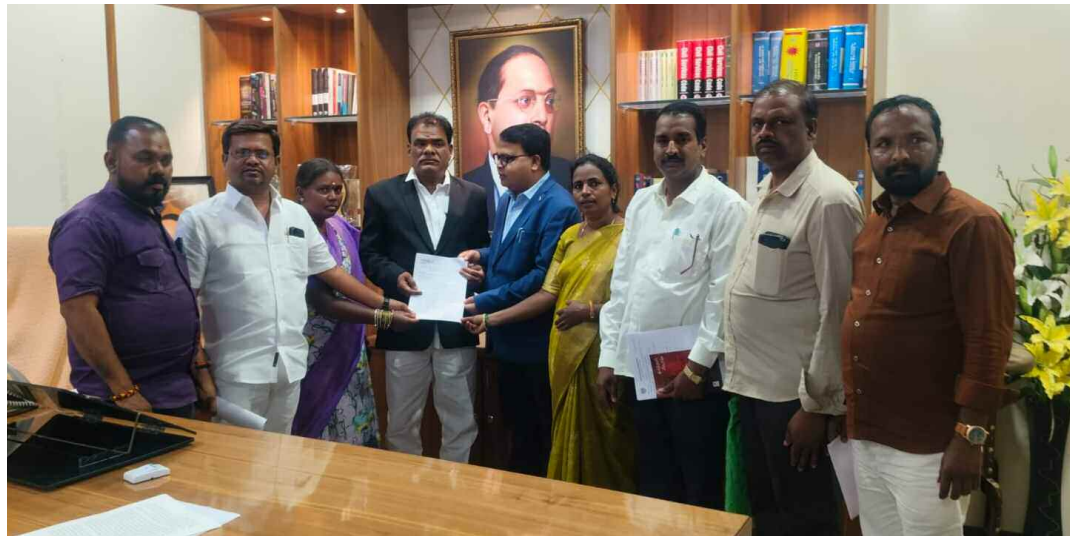
ఎస్సీ, ఎస్టీ కమిషన్ చైర్మన్ కు ఫిర్యాదు చేస్తున్న బాధితులు

ప్రభుత్వం శాంక్షన్ చేసిన ఇందిరా శక్తి మహిళా పథకం వనిత టీ స్టాల్ ను కలెక్టర్ ఆఫీస్ ప్రహారీ గోడ బయట మూల వద్ద ఉన్న వనిత టీ స్టాల్ ను అక్కడి నుండి తొలగించాలని మున్సిపల్ రెవెన్యూ కరెంటు ఫుడ్ సెఫ్టీ డిపార్ట్మెంట్ అధికారులతో ఈ నెల 10 వ తేదీ నుండి ఇబ్బందుల గురిచేస్తూ టీ స్టాల్ ను తొలగించాలని క్రేస్తు జెసిబి లతో తొలిగించే ప్రయత్నం చేసి తనను మానసికంగా, ఆర్థికంగా ఇబ్బందులకు గురి చేసారని, ఈ విషయం పైన కలెక్టర్ ను కలిసి తన బాధ చెప్పుకుందామని వెళ్లి కాళ్ళు, ఏళ్ల పడిన కూడా కనీసం పట్టించుకోకుండా అవమానకరంగా చూస్తూ అవమానపరిచాడని, తన గర్వం