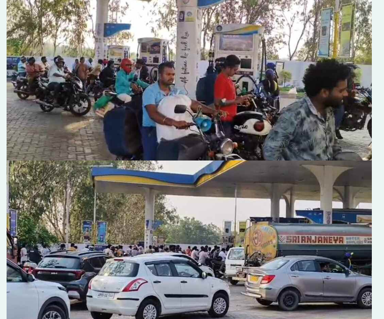
రాజేంద్రనగర్ లో పెట్రోల్ బంకల వద్ద రద్దీ