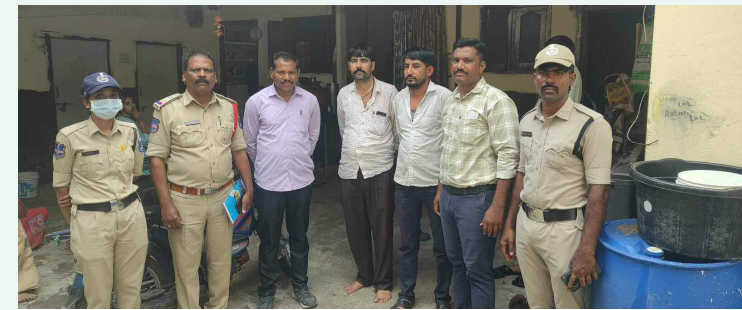
నకిలీ ఐస్ క్రీమ్ తయారు చేస్తున్న వారి ని ఆర్డర్స్ చేసిన పోలీసులు