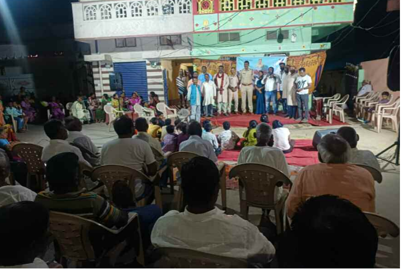
అవగాహన కల్పిస్తున్న సిబ్బంది