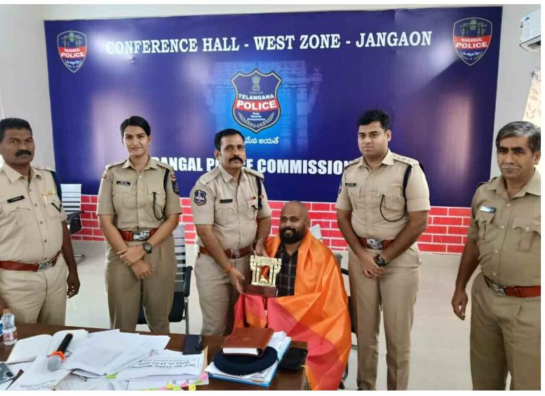
డాక్టర్ ను సన్మానం చేస్తున్న డిసిపి