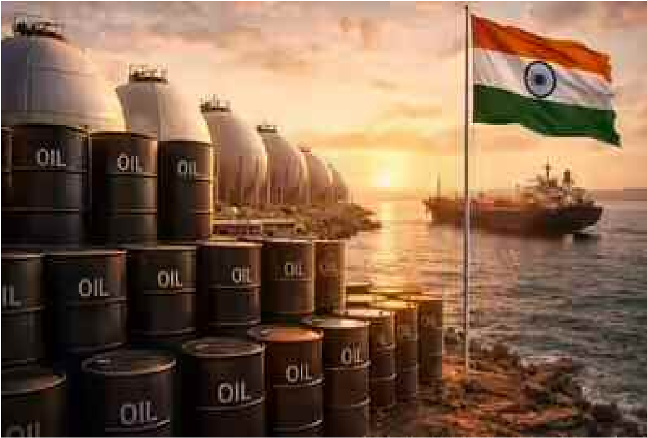
న్యూఢిల్లీ, మార్చి 26 (ప్రభాత ఉదయం)

తప్పుడు ప్రచారాలు నమ్మవద్దు.. మరోసారి స్పష్టం చేసిన కేంద్రం