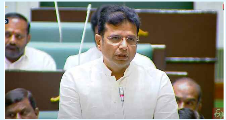
హైదరాబాద్, మార్చి 26 (ప్రభాత ఉదయం)

దావోస్ పర్యటనలో రూ.2.19 లక్షల కోట్లు పెట్టుబడులు విపక్షాల విమర్శలను తిప్పికొట్టిన శ్రీధర్ బాబు