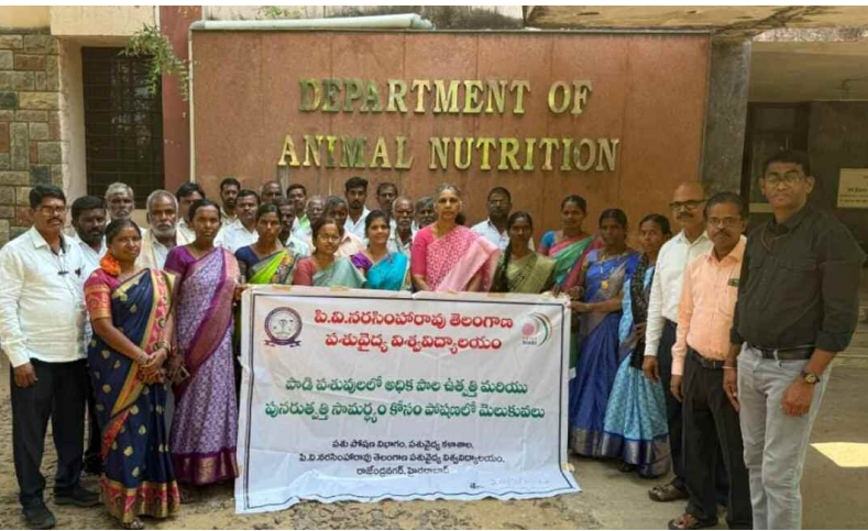
శిక్షణలో పాల్గొన్న రైతులు