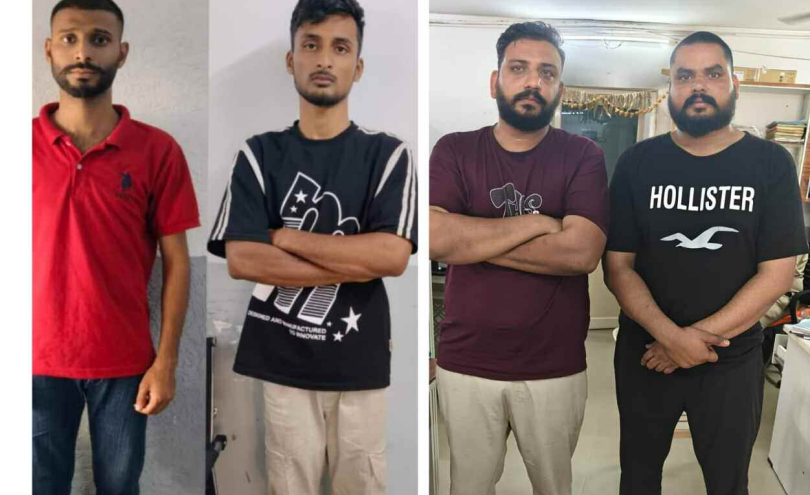
పాన్ షాప్ నిర్వాహకునిపై దాడి చేసిన యువకులు