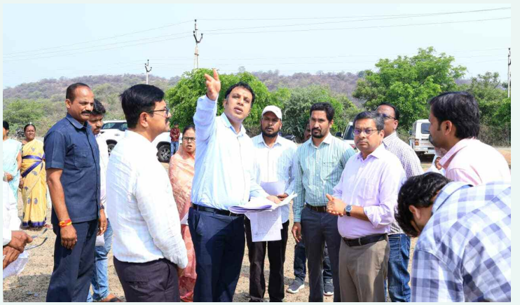
సోలార్ పవర్ ప్లాంట్ స్థానాన్ని పరిశీలిస్తున్న జిల్లా కలెక్టర్