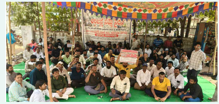
శివరాపల్లి లో గల రాజేంద్రనగర్ విద్యుత్ డి ఈ కార్యాలయం ముందు నిరసన వ్యక్తం చేస్తున్న ఆర్జిజన్లు