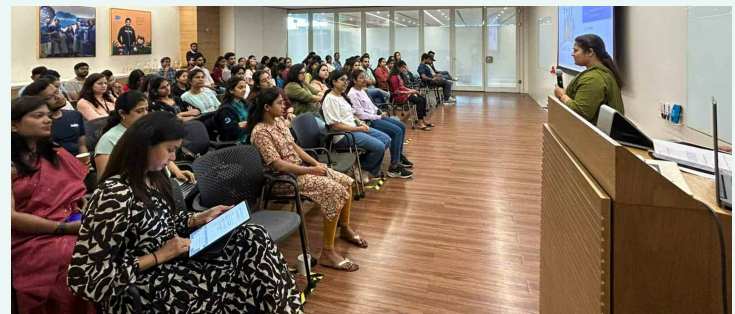
వేదంపల్లి మహిళా బడి ఉద్యోగులకు అవగాహన కల్పిస్తున్న ఓటిసీ అధికారులు...