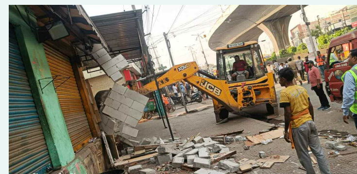
ఆక్రమణలను తొలగిస్తున్న అధికారులు