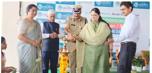
హోస్పిటల్స్ హాస్పిటల్స్ లో అత్యవసర సేవలను శోధిస్తున్న ప్రజలను చేసే ప్రారంభము, ముఖ్య అతిథులు.