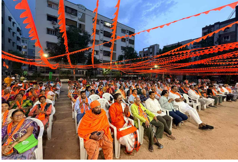
హిందూ సమైక్యతానికే హోదా ఇచ్చిన భక్తులు.