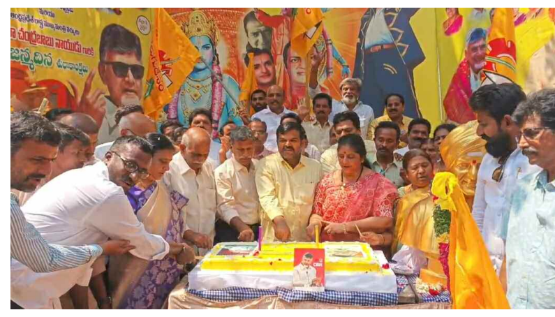
కేక కట్ చేస్తున్న డిడిపి నాయకులు