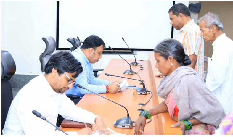
దరఖాస్తులు స్వీకరిస్తున్న కలెక్టర్, అదనపు కలెక్టర్