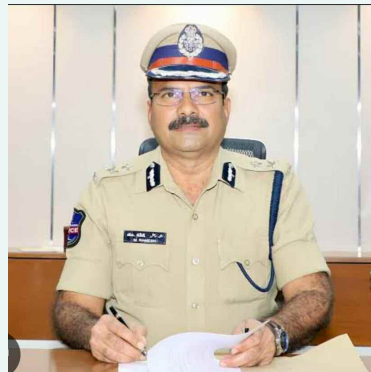
సైబరాబాద్ పోలీస్ కమిషనర్ డాక్టర్ రమేష్

సైబరాబాద్ పోలీస్ కమిషనర్ లో పరిధిలో ప్రారంభం కానున్న ఇంటర్మీడియట్ ఎస్.ఎస్.సి (తెలంగాణ ఓపెన్ స్కూల్ సాఫ్ట్ ) పరీక్షల దృష్ట్యా కమిషనరేట్ పరిధిలోని అన్ని పరీక్షా కేంద్రాల వద్ద 144 సెక్షన్ అమలు చేస్తున్నట్లు సైబరాబాద్ పోలీస్ కమిషనర్ డా. ఎం. రమేష్ తెలిపారు. శాంతిభద్రతల పరిరక్షణ పరీక్షలు సజావుగా సాగేలా చూడటం కోసం ఈ నిర్ణయం తీసుకున్నట్లు ఆయన పేర్కొన్నారు. ఈ ఉత్తర్వులు ఏప్రిల్ 20 నుండి ఏప్రిల్ 27 వరకు ప్రతిరోజూ ఉదయం 6 గంటల నుండి సాయంత్రం 6 వరకు అమల్లో ఉంటాయని తెలిపారు. ఐదుగురు అంతకంటే ఎక్కువ మంది చేరారాదు. పరీక్షా కేంద్రాల చుట్టూ 200 మీటర్ల పరిధిలో ఐదుగురు లేదా అంతకంటే ఎక్కువ మంది వ్యక్తులు గుమిగూడటం నిషేధం. జిరాక్స్ సెంటర్ల మూసివేత పరీక్షా కేంద్రాలకు 100 మీటర్ల లోపు ఉన్న అన్ని జిరాక్స్ సెంటర్లు ఇంటర్నెట్ సెంటర్లను పరీక్షా సమయంలో మూసి ఉంచాలి. ఈ నిబంధనలను ఉల్లంఘించిన వారిపై చట్టపరమైన కఠిన చర్యలు తీసుకోవడం జరుగుతుందని కమిషనర్ హెచ్చరించారు. విధులు నిర్వహిస్తున్న పోలీస్ అధికారులు మిలిటరీ సిబ్బంది, హోం గార్డులు, విద్యాశాఖకు చెందిన ఫ్లయింగ్ స్క్వాడ్ అధికారులకు వర్తించని తెలిపారు. పరీక్షలు పారదర్శకంగా ప్రశాంత వాతావరణంలో జరిగేందుకు ప్రజలు పోలీసులకు సహకరించాలని కమిషనర్ కోరారు.