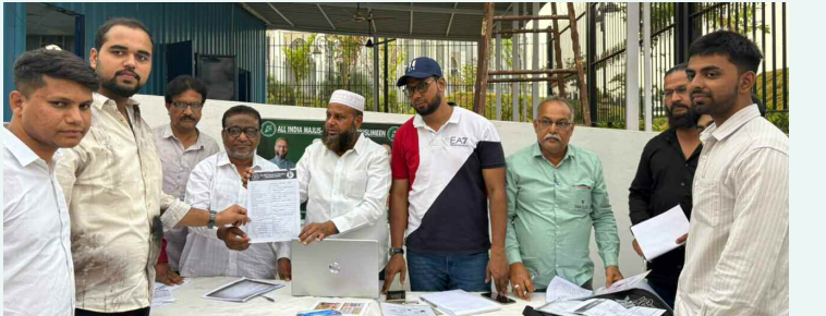
ఎన్ ఐ ఆర్ పూర్వచేసిన వర్తమాను మహిళా కార్మికుల హాజరే జైన్ ఆంఫ్ కు అందజేస్తున్న ప్రజలు