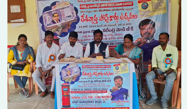
పోస్ట్ కార్డ్ కార్యక్రమం లో పాల్గొన్న నాయకులు