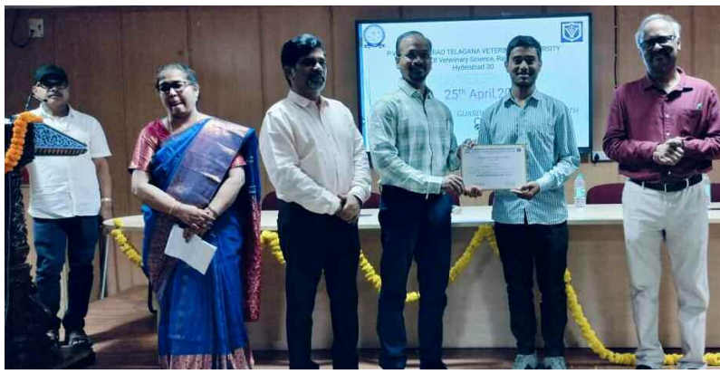
విద్యార్థికి సర్టిఫికేట్ ను బహుకరిస్తున్న అధికారులు