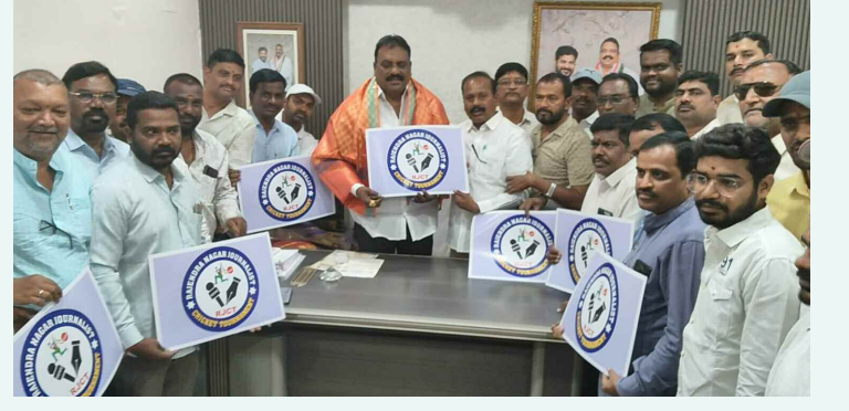
జర్నలిస్టు క్రికెట్ పోటీ లో గో ను అభిషేకిస్తున్న రాజేంద్రనగర్ ఎమ్మెల్యే డి. ప్రకాష్ గౌడ్

ప్రాఫెసర్ జయశంకర్ తెలంగాణ వ్యవసాయ విశ్వవిద్యాలయం 0 ద్వారా వచ్చే విద్యా సంవత్సరం నుంచి 30 బీఎస్సీ హార్దికల్లర్, 8 ఎమ్మెస్సీ సీట్లు భర్తి చేయనున్నట్లు వార్తలు వస్తుండటంతో రాజేంద్రనగర్ లో ఉన్న హార్దికల్లర్ కళాశాల విద్యార్థులు శనివారం నిరసన కు దిగారు. 2007లో ప్రత్యేకంగా ఉద్యోగ విశ్వవిద్యాలయం ఏర్పడిందని గుర్తు చేశారు. హార్దికల్లర్ సీట్లు ఏమైనా భర్తి చేయాలంటే ఉద్యోగ విశ్వవిద్యాలయం నుంచి చేయాల్సి ఉంటుందన్నారు. అలా కాకుండా వ్యవసాయ విశ్వవిద్యాలయంలో హార్దికల్లర్ సీట్లు భర్తి చేస్తే ఉద్యోగ విశ్వవిద్యాలయం ఉనికికి ప్రమాదం ఏర్పడుతుందన్నారు. ప్రభుత్వం నుండి ఉద్యోగ విశ్వవిద్యాలయంలోనే హార్దికల్లర్ సీట్లను భర్తి చేయాలన్నారు. ఎట్టి పరిస్థితులలో వ్యవసాయ విశ్వవిద్యాలయం ద్వారా హార్దికల్లర్ సీట్లను భర్తి చేయించవద్దన్నారు.