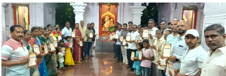
హిందూ సమ్మేళనం పోస్టర్ విడుదల చేస్తున్న హైందవ ప్రతినిధులు