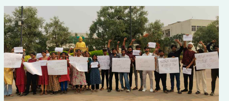
రాజేంద్రనగర్ లో నిరసన తెలుపుతున్న ఉద్యోగ కళాశాల విద్యార్థులు