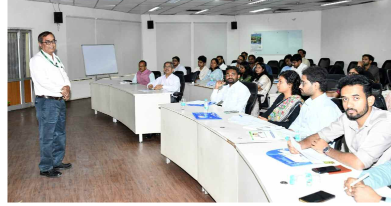
వ్యవసాయ విశ్వవిద్యాలయం నంద్యింపల్లి శిక్షణలో ఉన్న డిప్యూటీ కలెక్టర్లు