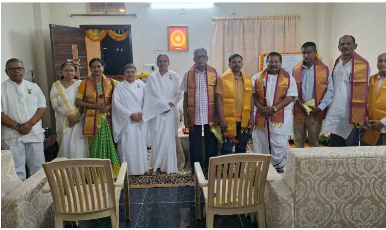
ఆధ్యాత్మిక కార్యక్రమంలో పాల్గొన్న బ్రహ్మ కుమారీలు, స్థానిక నాయకులు