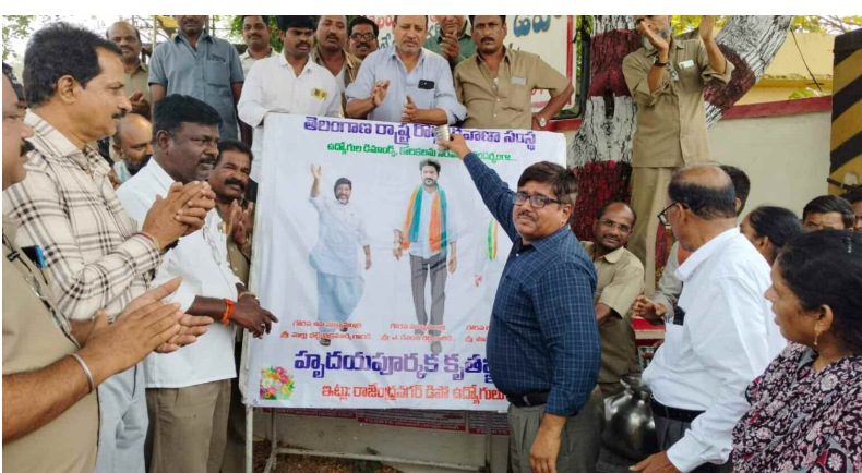
ముఖ్యమంత్రి రేవంత్ రెడ్డి చిత్ర పటానికి పాలాభిషేకం చేస్తున్న ఆర్టీసీ కార్మికులు, ఉద్యోగులు

అత్యధిక సర్కిల్ పరిధిలోని హైదర్ గూడ(ఎర్రబోడ)లో మే 3 తేదీన నిర్వహించనున్న హిందూ సమ్మేళనం పోస్టర్ ను స్థానికులు శనివారం విడుదల చేశారు. స్థానిక హైందవ సోదరులు ఎర్ర బోడ లోని బీరపు అలయంలో భారీ సమ్మేళనం తరలివచ్చి హిందూ సమ్మేళనం ఆహ్వాన పత్రాలను విడుదల చేశారు. ఈ సందర్భంగా హైందవ ప్రతినిధులు మాట్లాడుతూ... హిందూ సమ్మేళనానికి భారీ సమ్మేళనం తరలివచ్చి విజయవంతం చేయాలని కోరారు.