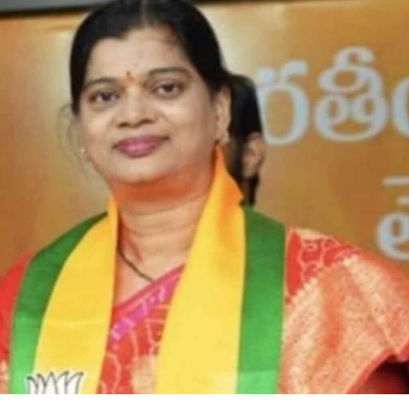
లో తనకంటూ ప్రత్యేక గుర్తింపు సాధించారు. అంచలంచలుగా ఎదుగుతూ