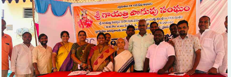
సహాయకంలో పాల్గొన్న శ్రీ గాయత్రి పొదుపు సంఘం సభ్యులు