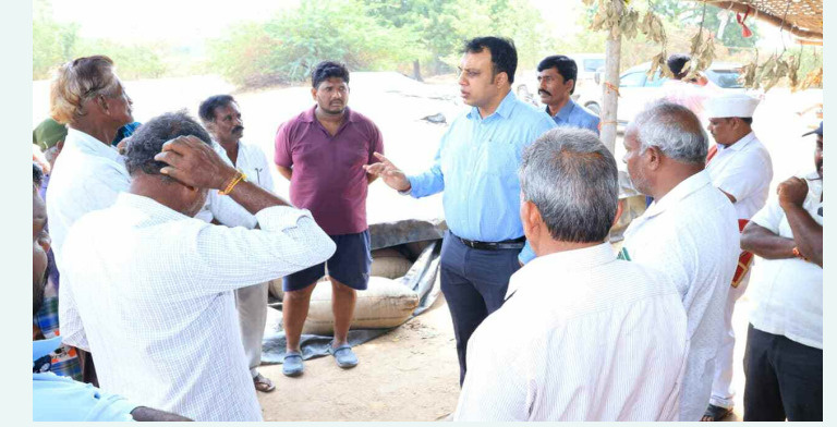
రైతులకు మాట్లాడుతున్న జిల్లా కలెక్టర్