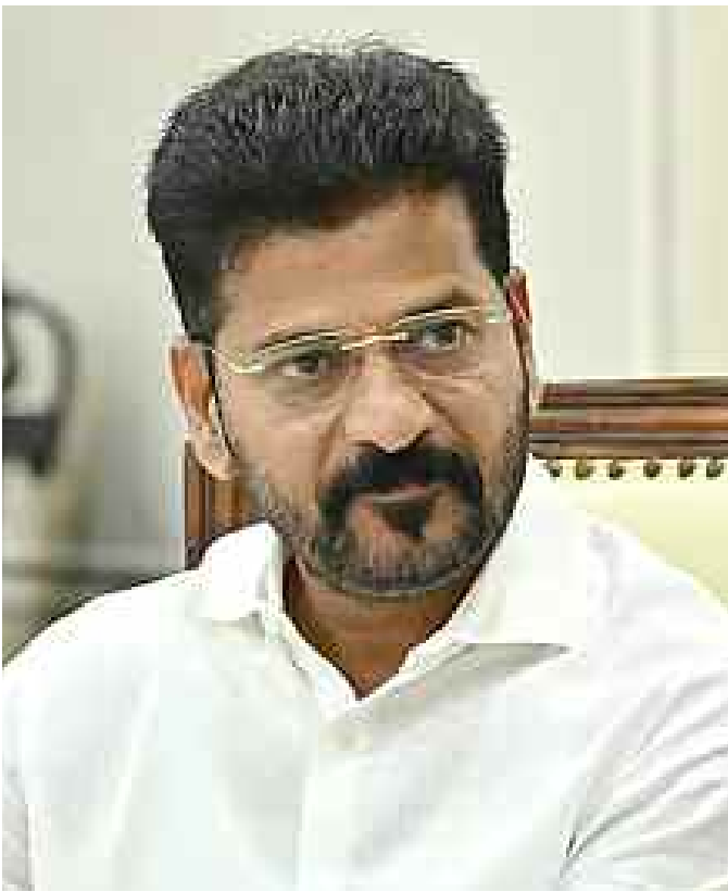
హైదరాబాద్, ఏప్రిల్ 27 (ప్రభాత ఉదయం)

ఉద్యమం అప్పుడు ఎలా మాట్లాడినా సహించారు - చిట్చాట్లో సీఎం రేవంత్ రెడ్డి