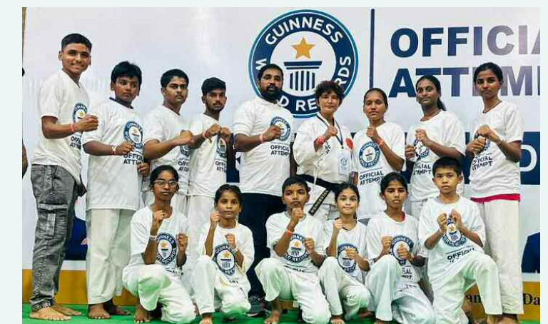
గిన్నీస్ వరల్డ్ రికార్డ్ సాధించిన టైక్వాండో విద్యార్థులు