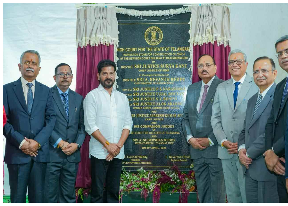
హైదరాబాద్, ఏప్రిల్ 5 (ప్రభాత ఉదయం)

సుప్రీంకోర్టు ప్రధాన న్యాయమూర్తి జస్టిస్ సూర్యకాంత్ చేతుల మీదుగా కార్యక్రమం ప్రజాస్వామ్యానికి ప్రతీకగా కొత్త భవనం నిలుస్తుందన్న సీఎం రేవంత్ 2027 డిసెంబర్ నాటికి నిర్మాణం పూర్తి చేయాలని లక్ష్యం