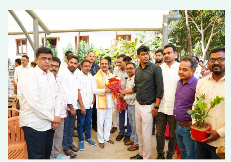
ఎంపీ ఈటల రాజేందర్ పుస్తకం అందజేస్తున్న వ్యవసాయ శాస్త్రవేత్తలు

స్ఫూరించుకోవడం ప్రతి ఒక్కరి బాధ్యత అని పేర్కొన్నారు. ఆయన దేశానికి, ముఖ్యంగా అణగారిన వర్గాల అభ్యున్నతికి చేసిన సేవలు చిరస్మరణీయమని తెలిపారు. జగ్జీవన్ రామ్ ఆశయాలను భావి తరాలకు తీసుకెళ్లాలని సూచించారు. సమాజంలో బదులు, బలహీన వర్గాల బిడ్డలతో ఎంతో ముఖ్యమన్నారు. ప్రతి ఒక్కరూ నిబద్ధతతో క్రమబద్ధమైన జీవితాన్ని అలవరచుకోవాలన్నారు. 18 ఏళ్లు నిండిన వారు మాత్రమే వాహనాలను నడవాలని, వాహనదారులు తప్పనిసరిగా శిరస్రాజం (హెల్మెట్ ) ధరించాలని సూచించారు. రోడ్డు భద్రత నియమాలను ఖచ్చితంగా పాటించాలని తెలిపారు. ప్రస్తుతం పెరుగుతున్న సైబర్ నేరాల పట్ల ప్రజలు అప్రమత్తంగా ఉండాలని, వ్యక్తిగత సమాచారాన్ని ఎవరితోనూ పంచుకోకూడదని సూచించారు. తదనంతరం అదనపు కలెక్టర్ (రెవెన్యూ) మాట్లాడుతూ.. ఈరోజు ఒక గొప్ప రోజు అని, సమాజంలో మార్పు కోసం తన జీవితాన్ని అంకితం చేసిన మహానుభావుడిని స్ఫూరించుకుంటున్నామని, ఆయన జీవితం అందరికీ ఒక