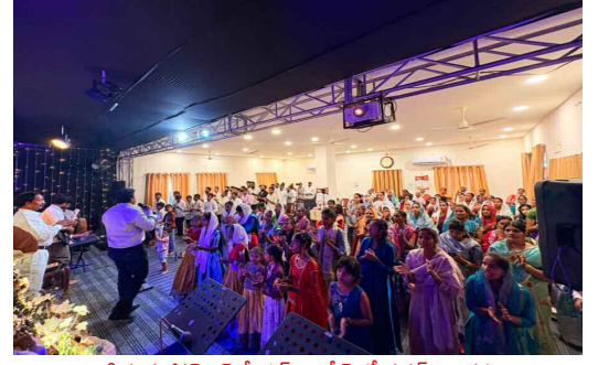
లక్ష్మీగూడ జీసస్ క్రైస్ట్ ప్రేయర్ మినిస్ట్రీస్ లో ఈస్టర్ ఆరాధనలు