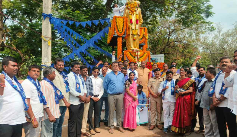
డాక్టర్ బాబు జగ్జీవన్ రామ్ జయంతి లో కలెక్టర్

దేశవ్యాప్తంగా ఎల్వీజీ సిలిండర్ల సరఫరాలో ఎలాంటి అటంకాలు లేవని, దీనిపై ప్రజలు ఆందోళన చెందాల్సిన అవసరం లేదని కేంద్ర ప్రభుత్వం స్పష్టం చేసింది. 5 కిలోల ఎల్వీజీ(ఎఫ్ఎల్ఎల్ సిలిండర్లు) అమ్మకాలను గణనీయంగా పెంచినట్లు పేర్కొంది. డిస్ట్రిబ్యూషన్ కేంద్రాల్లో గుర్తింపు కార్డులను చూపించి వీటిని పొందొచ్చని, నివాస ప్రవేశికరణ పత్రాలతో పనిలేదని తెలిపింది. గత నెల 23 నుంచి ఇప్పటివరకూ 6.6 లక్షలకు పైగా ఎఫ్ఎల్ఎల్ సిలిండర్లను ప్రజలు కొనుగోలు చేసినట్లు కేంద్ర చమురు మంత్రిత్వ శాఖ వెల్లడించింది. ఒక్క శనివారం(4వ తేదీ) రోజే 51 లక్షల గృహవినియోగ సిలిండర్లను డెలివరీ చేసినట్లు పేర్కొంది. అందులో 95 శాతం ఆన్లైన్లో బుకింగ్ చేసినవే అని చెప్పింది. 50వేలకు పైగా సిలిండర్ల స్వాగతం భాక్తవార్యల్లో గ్యాస్ సిలిండర్లు అమ్ముతున్నవారిపై కఠిన చర్యలు తీసుకుంటున్నట్లు కేంద్రం తెలిపింది. గత నెల నుంచి ఇప్పటివరకూ అక్రమంగా నిల్వ ఉంచిన 50వేలకు పైగా సిలిండర్లను స్వాధీనం చేసుకున్నట్లు తెలిపింది. దీంతోపాటు 1,400కు పైగా డిస్ట్రిబ్యూటర్లకు షోకాజ్ నోటీసులు జారీ చేశామని, 36 డీలర్షిప్లను సస్పెండ్ చేసినట్లు పేర్కొంది. గృహ వినియోగం, అత్యవసర సేవల(ఆసుపత్రులు, విద్యాసంస్థలు) కోసం ప్రభుత్వం ఎల్వీజీ, పీఎన్జీ సరఫరాలకు ప్రాధాన్యం ఇస్తోంది. గృహోలు, రవాణా రంగాలకు పీఎన్జీ సరఫరా పుర్తియిలో కొనసాగుతున్నట్లు కేంద్రం స్పష్టం చేసింది.