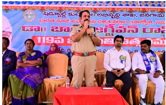
మాట్లాడుతున్న డీసీపీ రాజమహేంద్ర నాయక్

జనగామ జిల్లా ప్రతినీధి, ఏప్రిల్ 05(ప్రభాత ఉదయం):