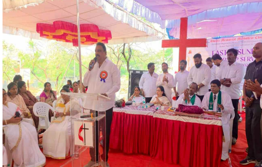
బుద్వేల్ ఈస్టర్ హిల్స్ లో మాట్లాడుతున్న ఎమ్మెల్యే డి ప్రకాష్ గౌడ్