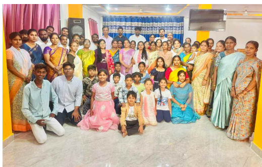
హైదర్ గూడ ఆం పే ప్రేయర్ టెంపుల్ లో జరిగిన ఈస్టర్ ఆరాధనలో పాల్గొన్న విశ్వామణి