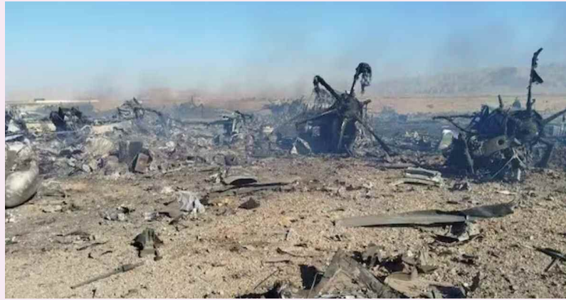
న్యూఢిల్లీ, ఏప్రిల్ 5 (ప్రభాత ఉదయం)

అమెరికాకు చెందిన సీ-130 విమానాన్ని కూల్చివేసినట్లు ప్రకటించిన ఇరాన్ అమెరికాకు త్వరలో పెద్ద సర్ప్రైజ్ ఇస్తామని తీవ్ర హెచ్చరికలు తమ అసమాన యుద్ధ తంత్రంతో శత్రువును దెబ్బతీస్తామని వ్యాఖ్య