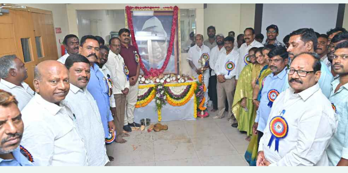
జలమండలి కేంద్ర కార్యాలయంలో బాబు జగ్జీవన్ రామ్ దిత్రవలానికి పుస్తానాన్ని ఈడీ సంతోషం.