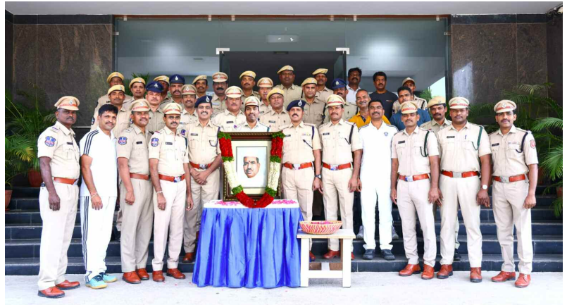
డాక్టర్ బాబు జగ్జీవన్ రామ్ విగ్రహానికి ఉపవాళ్లు అర్పిస్తున్న పోలీస్ అధికారులు