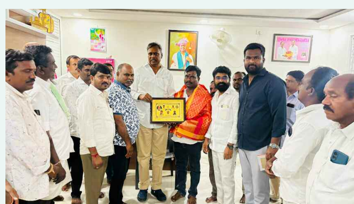
అవార్డు గ్రహీతను సన్మానం చేసిన ఎమ్మెల్యే

అదుగుపెట్టినట్లు అధికారులు తెలిపారు. ఈ ఘటన సంచలనం సృష్టించగా, ఢిల్లీ పోలీసులు నిందితుడిని అరెస్టు చేసి వాహనాన్ని స్వాధీనం చేసుకున్నారు. ప్రాథమిక సమాచారం ప్రకారం, గేట్ నెంబర్ 2 వద్దనున్న ఇసుక బ్యారీయర్ ను ఛేదించుకుంటూ ఒక వాహనం అసెంబ్లీ ఆవరణలోకి అడుగుపెట్టింది. వాహనం డ్రైవరు స్పీకర్ విజేందర్ గుప్తా కార్యాలయం వైపు దూసుకుపోయాడు. కార్యాలయం ముందు షవర్ బోక్ ఉండడంతో పాటు స్పీకర్ కారుపై ఇంకా చల్లినట్లు గుర్తించారు. ఘటన అనంతరం వాహనం అక్కడి నుంచి వెళ్లిపోయింది. హైసెక్యూరిటీ జోన్ లో ఈ ఘటన చోటుచేసుకోవడం భద్రతా అందోళనలను మరింత పెంచినట్లు చెబుతున్నారు. ఈ ఘటనపై అప్రమత్తమైన ఢిల్లీ పోలీసులు వెంటనే విచారణ చేపట్టారు. నిందితుడిని అరెస్టు చేసి కారును స్వాధీనం చేసుకున్నారు. కాగా, అసెంబ్లీ ప్రాంతంలో ఉంచిన పుష్పగుచ్ఛంలో ఎలాంటి బాంబు లేదని పోలీసులు తేల్చారు. ప్రస్తుతం సీసీటీవీ ఫుటేజీను స్వాధీనం చేసి వాహనం డ్రైవరు ఈ ఘటనకు పాల్పడడానికి కారణంపై విచారణ జరుపుతున్నారు. ఇటీవల ముగిసిన ఢిల్లీ అసెంబ్లీ బడ్జెట్ సమావేశాల సమయంలోనూ అసెంబ్లీకి బాంబు బెదిరింపులు వచ్చాయి. తాజా ఘటనతో హైసెక్యూరిటీ జోన్ లో భద్రతా ఉల్లంఘనలు మరింత అందోళనలను కలిగిస్తున్నాయి.