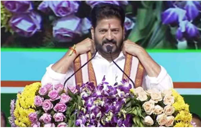
హైదరాబాద్, ఏప్రిల్ 6 (ప్రభాత ఉదయం)

ప్రతిపక్ష ఎమ్మెల్యేలకు కూడా వేదికలపై మాట్లాడే అవకాశం కల్పిస్తున్నామన్న రేవంత్ ఆదిలాబాద్ జిల్లాలో అతిపెద్ద పారిశ్రామికవాడను ఏర్పాటు చేయనున్నట్టు వెల్లడి జిల్లాలో త్వరలో యూనివర్శిటీ నిర్మిస్తామన్న సీఎం