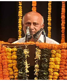
మాట్లాడుతున్న దేశాల భూపాల