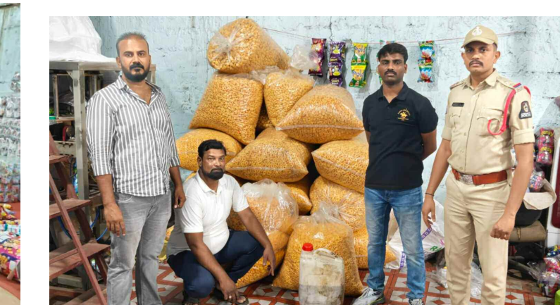
కుర్ కుర్ తయారీ గోదాము పై పోలీసుల దాడి

కల్తీ కుర్ కుర్ ఉత్పత్తులు, మసాలాలు తయారు చేస్తున్న రెండు పరిశ్రమలపై హైదరాబాద్ ఫుడ్ అడ్వలైజ్మెంట్ సర్కిల్ లెన్స్ టీం, ఫుడ్ సేఫ్టీ అధికారులు, మైలార్ డేవ్ వల్లి పోలీసులు సంయుక్తంగా దాడులు చేశారు. పోలీస్ స్టేషన్ పరిధిలోని టాటా నగర్ లో ఎలాంటి అనుమతులు లేకుండా