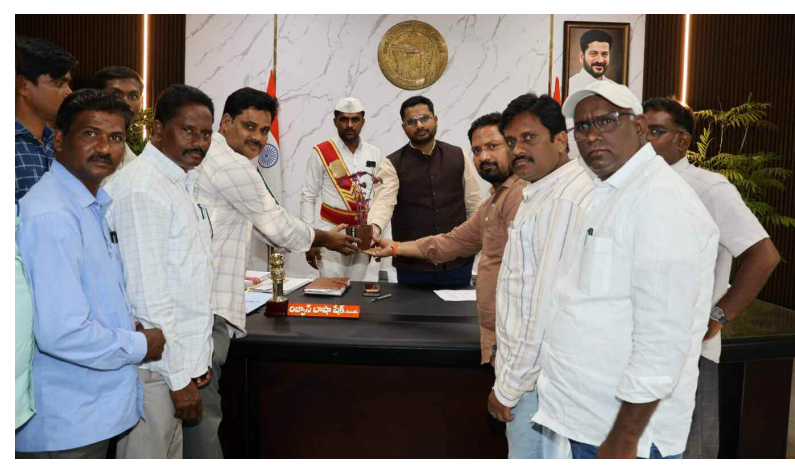
డి.ఆర్.ఎస్ సంఘం అధ్యక్షులలో ప్రాథమిక పూర్తి చేయాలని జిల్లా కలెక్టర్ కు వినిపిపత్రం అందజేస్తున్న గ్రామ పంచాయతీ అధికారులు

జిల్లాలో పదవ తరగతి పరీక్షలు కట్టుబట్టంగా నిర్వహించాలని జిల్లా కలెక్టర్ లిజ్యూస్ భాషా షేక్ అధికారులను ఆదేశించారు. మంగళవారం జిల్లా కేంద్రంలోని విశ్వభారతి టెక్ని పాఠశాలలో జరుగుతున్న పదవ తరగతి పరీక్ష నిర్వహణ తీరును ఆకస్మికంగా తనిఖీ చేశారు. ఈ సందర్భంగా కలెక్టర్ పరీక్షా కేంద్రంలోని తరగతి గదులను సందర్శించి, విద్యార్థులు పరీక్ష రాస్తున్న తీరును గమనించారు. పరీక్షా కేంద్రాల్లో ఎలాంటి మోల్ ప్రాక్టీస్ కు అవకాశం లేకుండా పరీక్షలను కట్టుబట్టంగా నిర్వహించాలని అధికారులకు ఆదేశించారు. కేంద్రంలోకి ఎలక్ట్రానిక్ పరికరాలు, సెల్ ఫోన్లు అనుమతించరాదని అన్నారు. పరీక్ష సమయంలో బిట్ పేపర్ను సమయానికి అందజేయాలన్నారు. సమాధాన పత్రాలను తీసుకునే సమయంలో పరిశీలించాలని సూచించారు. విద్యార్థులకు తాగునీరు అందుబాటులో ఉండేలా చూడాలని ఆదేశించారు. వేసవి ఎండల దృష్ట్యా విద్యార్థులు ఏదైనా అస్వస్థతకు గురైతే, వెంటనే వైద్య సేవలు అందించేందుకు ఓఆర్ఎస్, అత్యవసర మందులు అందుబాటులో ఉంచాలని ఆదేశించారు. పరీక్షలు ముగిసిన తర్వాత అప్రమత్తతతో పకడ్బందీగా విధులు నిర్వహించాలని సూచించారు. ఎలాంటి తప్పిదాలకు అవకాశం ఇవ్వకుండా పూర్తి పారదర్శకంగా, పరీక్షలు నిర్వహించాలని సంబంధిత అధికారులకు ఆదేశించారు. ఈ కార్యక్రమంలో సంబంధిత పరీక్ష కేంద్రం అధికారులు, తదితరులు పాల్గొన్నారు.