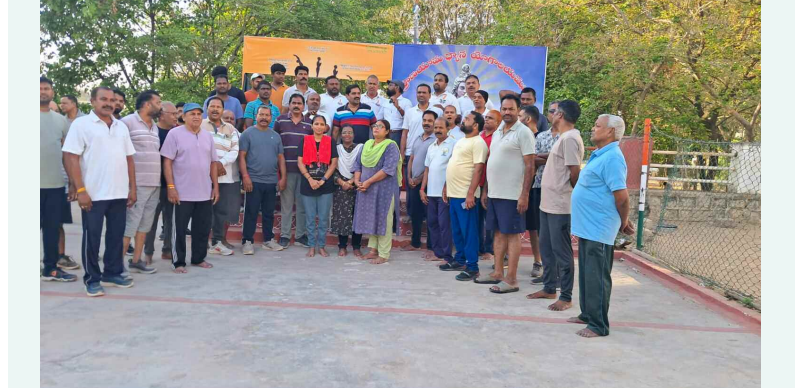
ఆరోగ్య దినోత్సవం లో పాల్గొన్న వాక్యస్