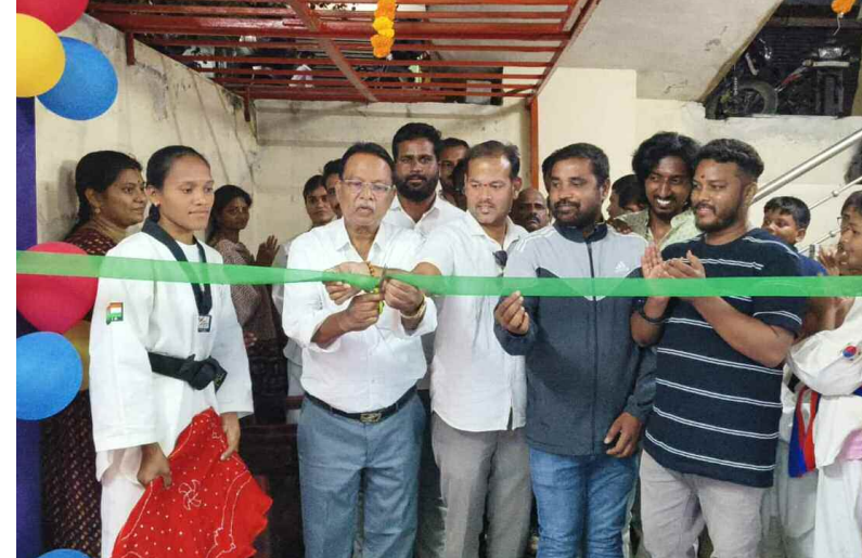
తైక్వాండో బాక్సింగ్ డ్యాన్స్ నూతన అకాడమీ ప్రారంభిస్తున్న ధృశ్యం