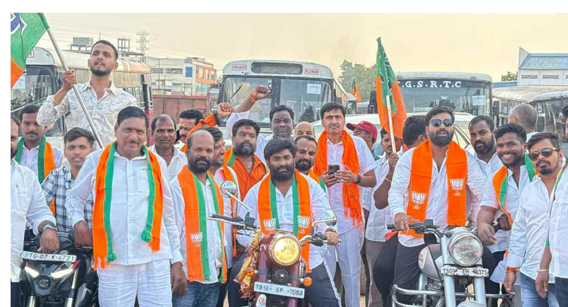
మైలార్ దేవుపల్లి నుంచి ప్రధాని మోదీ సభకు తరలివెళ్లిన బీజేపీ నాయకులు...

గారు చారిత్రాత్మకంగా మూడోసారి ప్రధానమంత్రిగా భార్యతలు స్వీకరించిన తర్వాత తొలిసారిగా తెలంగాణకు వస్తున్న మన గౌరవ ప్రధానమంత్రి కి రాజేంద్ర నగర్ నియోజక వర్గం మైలార్ దేవ్ పల్లి డివిజన్ నుండి పెద్ద ఎత్తున దుర్గా నగర్ చౌరస్తా నుంచి బైక్ ర్యాలీతో అదేవిధంగా 25 బస్సులు 100కార్లు సుమారు 2000 జన సమీకరణంతో సభకు తరలివెళ్లడం జరిగింది. దేశ ప్రయతమ ప్రధాని గౌరవనీయులైన నరేంద్ర మోదీ నాయకత్వం వర్తల్లాలి అని నిరూపాలతో నియోజకవర్గం మైలార్ దేవుపల్లి డివిజన్ నుంచి