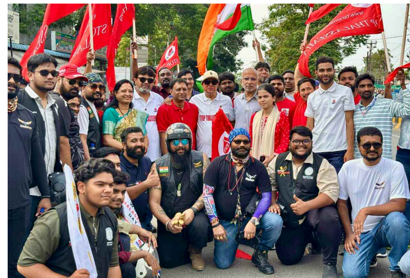
బైక్ ర్యాలీ లో పాల్గొన్న యువత