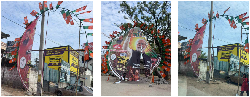
చివరి వేసిన జిజీవీ ప్లెక్సీలు