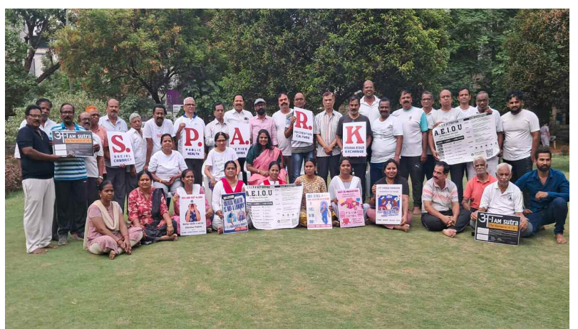
అత్తాపూర్ లక్ష్మీ నగర్ పార్కులో హార్మోన్ వాకర్స్

ప్రధానమంత్రి నరేంద్ర మోదీ బహిరంగ సభకు రాజేంద్రనగర్ నియోజకవర్గం నుంచి పెద్ద సంఖ్యలో ఆ పార్టీ నాయకులు, అభిమానులు తరలి వెళ్లారు. బస్సులు, కార్లు, మోటార్ సైకిల్ ల పై పార్టీ నాయకులు పెరేడ్ గ్రౌండ్ సభకు వెళ్లారు.