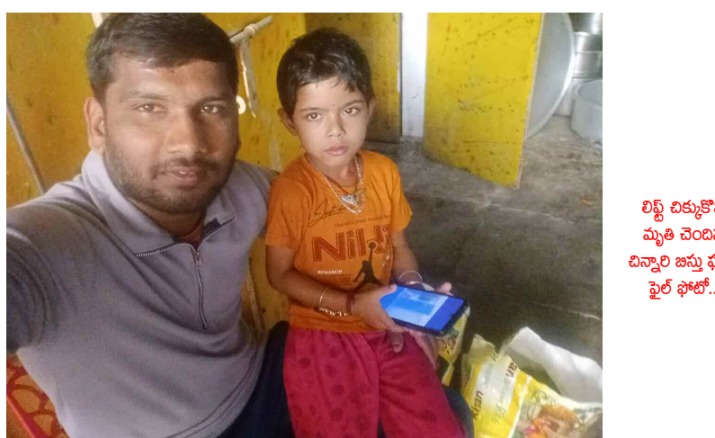
లిప్స్ బిక్కుకొని మృతి చెందిన చిన్నారుల జన్మ ఘోష వైల్ ఫోన్.