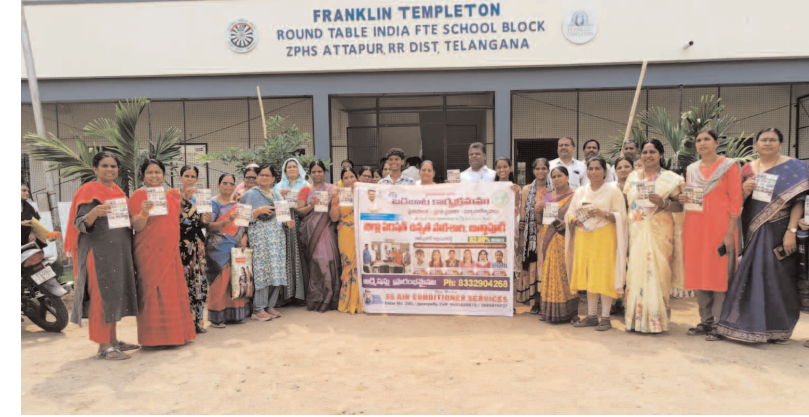
బడి బాట లో పాల్గొన్న ఉపాధ్యాయులు