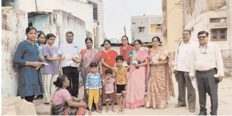
బుద్వేల్, మే 14 (ప్రభాత ఉదయం)