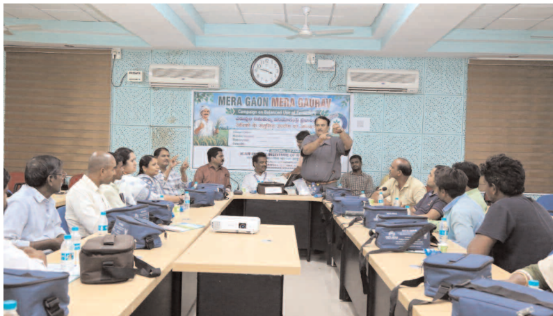
భారతీయ పరిశోధన సంస్థలో నేల పరిక్షలు అవగాహన కార్యక్రమంలో పాల్గొన్న రైతులు