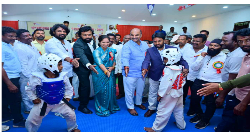
గద్వాల జిల్లా ప్రతినధి, మే 15 (ప్రభాత ఉదయం)