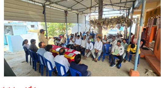
రైతులతో మాట్లాడుతున్న శాస్త్రవేత్తలు

ఎరువులతో పాటు సిఫారుసు చేసిన రసాయనిక ఎరువలనే వాదనలను సూచించారు. తద్వారా సాగు ఖర్చు తగ్గుతుందన్నారు. పచ్చి లాజ్టీ డైర్యు, జీవన ఎరువుల వినియోగం పెంచుకొని యూరియా వాడకాన్ని తగ్గించాలన్నారు. అలా చేయడం ద్వారా బీడ పీడల ఉధృతిని తగ్గించుకోవచ్చన్నారు. భూసార పరిరక్షణ, వాతావరణ కాలుష్య నివారణ సాధ్యమౌతుందన్నారు. సాగునీరు పద్ధతిలో సాగు చేయడం ద్వారా అధిక పంటలో ఫలం పొందుకునే అవకాశం ఉంటుందన్నారు. భూమి తరలకు నీటి కొరత లేకుండా ఇంకా గుంతలు, షాం పొండ్లు నిర్మించుకోవాలన్నారు. సాగునీటిని దుర్వినియోగం