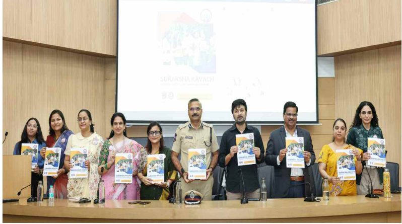
సురక్ష కవచ్ కార్యక్రమంలో హ్యాండ్ బుక్ అభివృద్ధిస్తున్న సీపీ డాక్టర్ రమేష్ ఇతర అధికారులు.