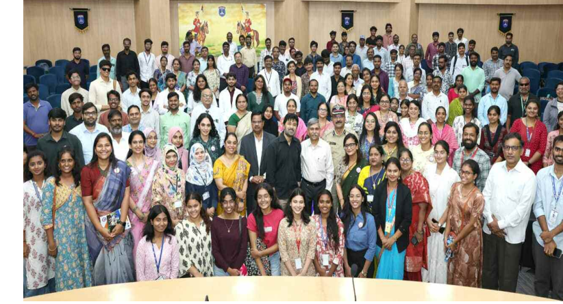
సమావేశానికి హాజరైన విద్యార్థులు సంస్థల ప్రతినిధులు.