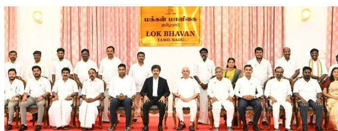
న్యూఢిల్లీ, మే 21 (ప్రభాత ఉదయం)

తమ పార్టీ నేతలు అధికారం కోసం విశ్వాసం, అంకితభావంతో గత 59 ఏళ్లుగా పనిచేస్తున్నారన్న హస్తం పార్టీ