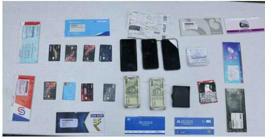
నిందితుల నుండి స్వాధీనం చేసుకున్న నగదు ఇతర పరికరాలు..

బ్యాంక్ అకౌంట్ల సమకాలిని భారీగా కమిషన్ ఇస్తామని వారు దిలబించి ఎర వేశారు. ఒక సేవింగ్స్ అకౌంట్ కు రూ. 25,000, కరెంట్ అకౌంట్ కు రూ. 50,000 ఇస్తామని ఆశ చూపారు. ఈ అకౌంట్లను డిజిటల్ అకౌంట్స్, ట్రేడింగ్ ప్రాద్, ఆన్లైన్ గేమింగ్ వంటి దారుణమైన సైబర్ నేరాల కోసం వారు తారిన తెలిసినా కేవలం దబ్బు విప్పితో దిలబి సింగ్ ఇందుకు అంగీకరించారు. తన ఖాతాలో పాటు ఇతరుల నుంచి సేకరించిన ఏటీఎం కార్డులు, సిమ్ కార్డులు, పాస్ బుక్స్, చెక్ బుక్స్ ను సేకరించి ఆ మూలాకు అప్పగించడం ప్రారంభించారు.