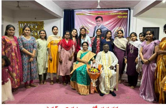
పాస్టర్ గారి కుటుంబంతో యువనస్థులు