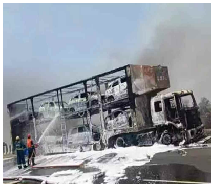
హైదరాబాద్, మే 21 (ప్రభాత ఉదయం)

ఎండలు మండిపోతున్న వేళ పెరుగుతున్న అగ్గిప్రమాదాలు మెదక్ జిల్లా తూప్రాన్ శివారులో కంటైనర్‌లో చెలరేగిన మంటలు