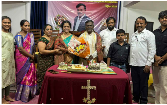
పాస్టర్ గారిని, పాస్టరమ్మ గారిని సన్మానిస్తున్న అప్పారెడ్డి గూడెం కుటుంబ సభ్యులు