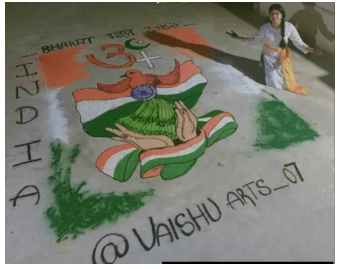
తాను గీసిన చిత్రాలతో వైశాలి సాగర్