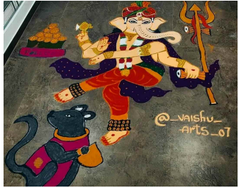
విశ్వేశ్వరుని చిత్రాన్ని గీసిన వైశాలి సాగర్