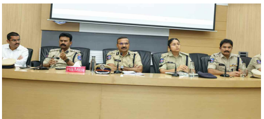
సమావేశం పాల్గొన్న సీపీ డీసీపీలు..