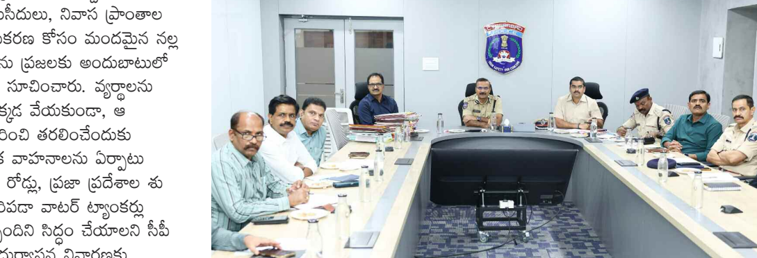
(3) బక్రీద్ పండుగ విషయపై జామ్ మీటింగ్ లో పోలీస్ అధికారులకు సూచనలను సీపీ ఇతర అధికారులు..