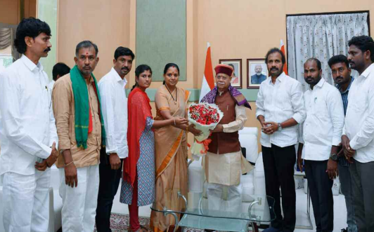
ముఖ్యమంత్రి అని, కాంగ్రెస్ ప్రభుత్వం దుర్భరమైన పాలన అందిస్తోందని ఆమె విమర్శించారు. వంద రూపాయల

మొదటి పేజీ తరువాయి... కేబ్లె కుమార్తెలకు గురైన బాధితులందరికీ ఇంటి స్థలాలు కేటాయించాలని, పరిగి మండలం కర్ణాటకలో ఇండస్ట్రియల్ పార్క్ కోసం జారీ చేసిన భూసేకరణ నోటీసును రద్దు చేయాలని వారు గవర్నర్ ను కోరారు. అలాగే, రిజిస్టర్ రింగ్ రోడ్ (ఆర్ఆర్ఆర్) అలైన్మెంట్ మార్పు, ఇతర భూసేకరణ సమస్యలను కూడా పరిష్కరించాలని విజ్ఞప్తి చేశారు. గవర్నర్ తో ఢిల్లీ అనంతరం కవిత మీడియాతో మాట్లాడుతూ.. ముఖ్యమంత్రి రేవంత్ రెడ్డి ప్రభుత్వంపై తీవ్రస్థాయిలో విరుచుకుపడ్డారు. మహిళల ఇళ్లను కూల్చివేస్తున్నారని, రేవంత్ రెడ్డి ఒక నిర్ణయమైన