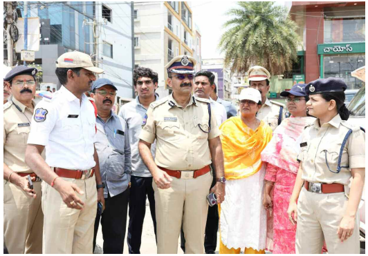
ట్రిబ్యుల్ ఐటీ జంక్షన్ పనుల పరిశీలించుకున్న సీపీ తోపాటు సిఎస్ అధికారులు.