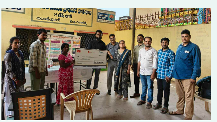
బాధిత కుటుంబానికి రూ 10 లక్షల చెక్కును అందజేస్తున్న తపాల శాఖ అధికారులు