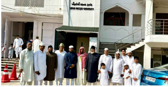
జన చైతన్య కాలనీ శామా మసీదు ఘరాణీగ వద్ద ముస్లిం సోదరులు