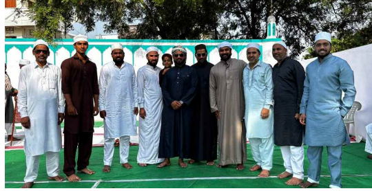
ప్రేమాచరి పేట వద్ద ముస్లిం సోదరులు