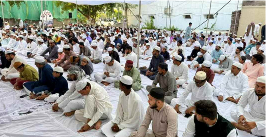
ప్రార్థనలో పాల్గొన్న ముస్లిం సోదరులు

బుద్ధేల్, మే 28 (ప్రభాత ఉదయం): రాజేంద్రనగర్, అత్తాపూర్ సర్కిళ్లలో గురువారం ఈడ్ ఉల్ అదా (బక్టేర్) పండుగను ముస్లిం సోదరులు ఘనంగా నిర్వహించారు. త్యాగానికి ప్రతీకగా ఈ పండుగ ను ముస్లిం సోదరులు జరుపుకుంటారు. పండుగ సందర్భంగా మసీదులు, ఈడాలలో ప్రత్యేక ప్రార్థనలు నిర్వహించారు. ఈడే అంటే పండుగ అని, ఖుర్ఆన్ అంటే త్యాగం అని బావిస్తూ ఈ పండుగను నిర్వహిస్తామని ముస్లిం సోదరులు పేర్కొన్నారు. అల్లాహ్ (దేవుడు) ఆదేశాను సారం తన ఏకైక కుమారుడైన ఇస్మాయిల్ ను బలి ఇవ్వడానికి సిద్ధపడిన ఇబ్రహీం ప్రవక్త యొక్క గొప్ప త్యాగాన్ని, అంకిత బావాన్ని