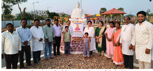
బుద్ధ జయంతి సందర్భంగా నివాళులు అర్పిస్తున్న కవులు

జనగామ జిల్లా ప్రతినీధి, మే 01 (ప్రభాత ఉదయం):