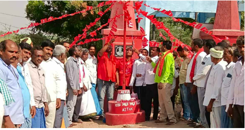
కడవెండి లో మేడే కార్యక్రమంలో పాల్గొన్న సిపిఐ, ఏఐటీఎమ్సీ నాయకులు

జిల్లా లోని దేవరపుల మండలం వ్యాప్తంగా సిపిఐ, ఏఐటీఎమ్సీ అనుబంధ కార్యకర్తల పాఠశాల సంఘం భవన నిర్మాణ సంఘం ఆధ్వర్యంలో మేడే సందర్భంగా కడవెండి కామారెడ్డి గూడెం, దేవరపుల, కోల్పాడ, పెద్దమడూర్, నిర్మల, సీతారాంపురం, చౌడూర్, మాదాపురం, ధర్మాపురం, కొత్తవాడ, తదితర గ్రామాలలో ఎర్ర జెండాలు ఎగురవేశారు.