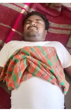
ఆత్మహత్య చేసుకున్న నర్సింహులు