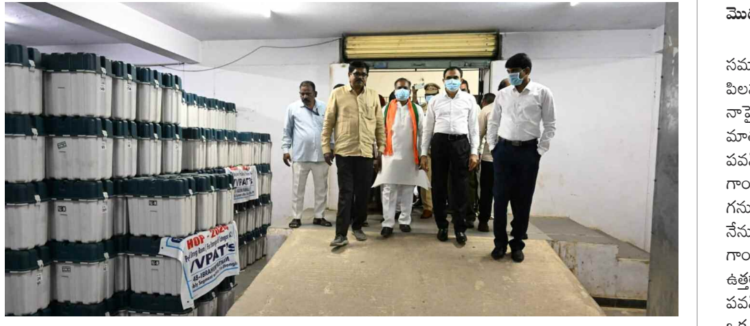
రంగారెడ్డి జిల్లా ప్రతినిధి, జూన్ 10 ప్రభాత ఉదయం