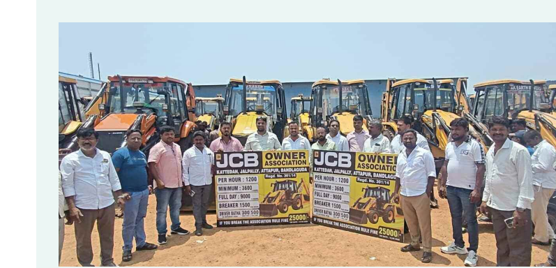
జే సీ జి ల ఛార్జీ లను పెంచాలని దుర్గా నగర్ లో నిరసన వ్యక్తం చేస్తున్న జేసీజి ల యజమానులు