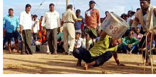
పల్లెలో నిఘా పెంపాటి సందెరాళ్ల ఎత్తే వాళ్లు (ఫ్రీట్ పోట్)

జాతరలు, గ్రామ దేవతల ద్యావర్లు, ఉర్బుల సందర్భంగా 40 కేజీల నుండి 120 కేజీల వరకు బరువుగల సందెరాళ్లను ఎత్తే పోటీలు నిర్వహించడం ఆసనామతంగా వస్తోంది. ఈ పోటీలలో పాల్గొనే 20-30 సంవత్సరాల వయసున్న యువత.. ఇటీవల బరువులు సులభంగా ఎత్తడానికి స్పెరాయిడ్స్, పెయిన్ కిల్లర్ ఇంజక్షన్లను విచ్చలవిడిగా వాడుతున్నారు. పోటీలు జరిగిన గ్రామాల్లో వాడి పారేసిన ఇంజక్షన్ సిరంజీలు లభ్యమవడంతో స్థానిక ప్రజలలో తీవ్ర భయాందోళనలు మొదలయ్యాయి. తాత్కాలికంగా కండలు పెంచే ఈ కృత్రిమ మందుల వల్ల భవిష్యత్తులో గుండెపోటు, కిడ్నీలు ఫెయిలు, అధ్వర్యం, కాలేయం పాడైపోవడం, నపుంసకత్వం వంటి ప్రాణాంతక సమస్యలు వస్తాయని వైద్య నిపుణులు హెచ్చరిస్తున్నారు.