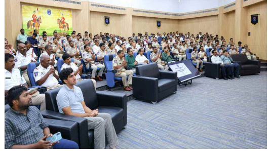
సదస్సుకు హాజరైన ఎస్.బి.ఎ.

సైబరాబాద్ ఎప్పటికీ వ్యక్తిత్వ వికాసం, నాయకత్వ లక్షణాలపై ప్రత్యేక సదస్సు పోలీసు శాఖ ఒక విశ్వసనీయ బ్రాండ్.. నైతిక విలువలు కాపాడాలి: సీపీ ఎం. రమేష్ శేరిలింగంపల్లి : జూన్ 10, ప్రభాత ఉదయం