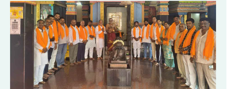
ప్రేమావతిపేట పాండురంగ్ శ్రీ శివరాజులను స్వామి దేవాలయంలో పూజలు చేస్తున్న జతపీ నాయకులు

మొదటి పేజీ తరువాయి... ప్రణాళికా పురోగతిని బుద్ధవారం ప్రత్యేకంగా పరిశీలించిన అనంతరం ఆయన మీడియాతో మాట్లాడారు. జూలై తొలి వారానికి అన్ని సాంకేతిక, హైడ్రాలజికల్ అడ్డంకులను పూర్తిచేయాలని, అనంతరం సేకరించిన నివేదికలను కేంద్ర జల సంఘం, జాతీయ ఆనకట్టల భద్రతా సంస్థలకు పంపుతామని తెలిపారు. వాటి సూచనల మేరకు, 2026 సెప్టెంబర్ నాటికి పునరుద్ధరణ డిజైన్లను ఖరారు చేస్తామని చెప్పారు. పర్యాటకం ముగిసిన వెంటనే నవంబర్ చివరి వారంలో లేదా డిసెంబర్ తొలి వారంలో పునరుద్ధరణ పనులు ప్రారంభిస్తామని, ఒకే పని సీజన్లో పనులు