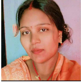
మృతులూ మీనా దేవి