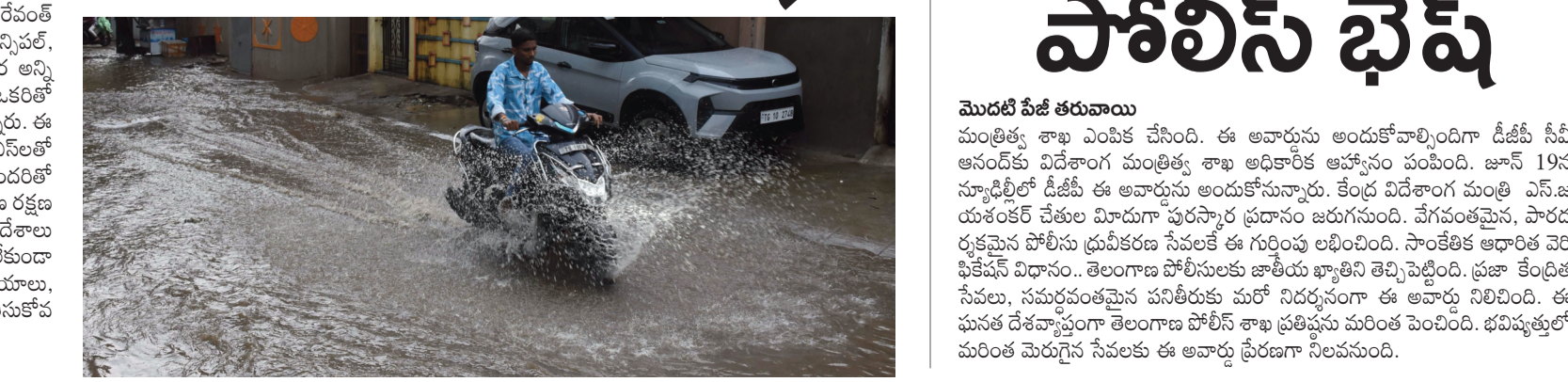
మధ్య సమన్వయం అత్యంత కీలకమని సీఎం రేవంట్ రెడ్డి పేర్కొన్నారు. పోలీస్, ట్రాఫిక్ పోలీస్, మున్సిపల్, హైద్రా, విద్యుత్ శాఖ, వాటర్ బోర్డ్ సహా ఇతర అన్ని సంబంధిత శాఖల అధికారులు క్షేత్రస్థాయిలో ఒకరితో ఒకరు సమన్వయం చేసుకుంటూ పనిచేయాలన్నారు. ఈ క్రమంలోనే చీఫ్ సెక్రటరీ, డీజీపీ, స్పెషల్ సీఎస్ లతో పాటు నగరానికి చెందిన సీనియర్ అధికారులందరితో యుద్ధ ప్రాతిపదికన సమీక్షలు నిర్వహించి, తక్షణ రక్షణ చర్యలు చేపట్టాలని ముఖ్యమంత్రి రేవంట్ రెడ్డి ఆదేశాలు జారీ చేశారు. ముఖ్యంగా ట్రాఫిక్ ఇబ్బందులు లేకుండా చూడటం, విద్యుత్ సరఫరాలో అంతరాయాలు, ప్రమాదాలు జరగకుండా ముందస్తు జాగ్రత్తలు తీసుకోవడంపై ప్రత్యేక దృష్టి సారించాలని స్పష్టం చేశారు.

ఎకానమీ పరిధిలో 'హై అల్ట్రా' ప్రకటించాలని, ఎప్పటికీ ఉన్నట్లు పరిస్థితులు సమాజంలో అందరినీ ఆదేశించాలి. వర్షం వల్ల నగరవాసులకు ఎలాంటి ఇబ్బందులు తలెత్తకుండా యుద్ధ ప్రాతిపదికన సత్కర చర్యలు చేపట్టాలని ముఖ్యమంత్రి స్పష్టం చేశారు. వాతావరణ శాఖ అందించే వర్ష సూచన వివరాల ఆధారంగా అధికారులు ముందస్తు ప్రణాళికలతో సిద్ధం కావాలని సీఎం సూచించారు. నగరంలో సాధారణంగా లోడ్ షెడ్డి సీర్ నిలిచే ప్రాంతాలు, లోతట్లు, సమస్యాత్మక ప్రాంతాలను గుర్తించి, అక్కడ ముందస్తుగానే అభ్యవసర సమయంలో మోహరించాలని ఆదేశించారు. ఇలాంటి విపత్తుల పరిస్థితుల్లో ప్రజలకు ఇబ్బంది కలగకుండా ఉండాలంటే వివిధ ప్రభుత్వ శాఖల