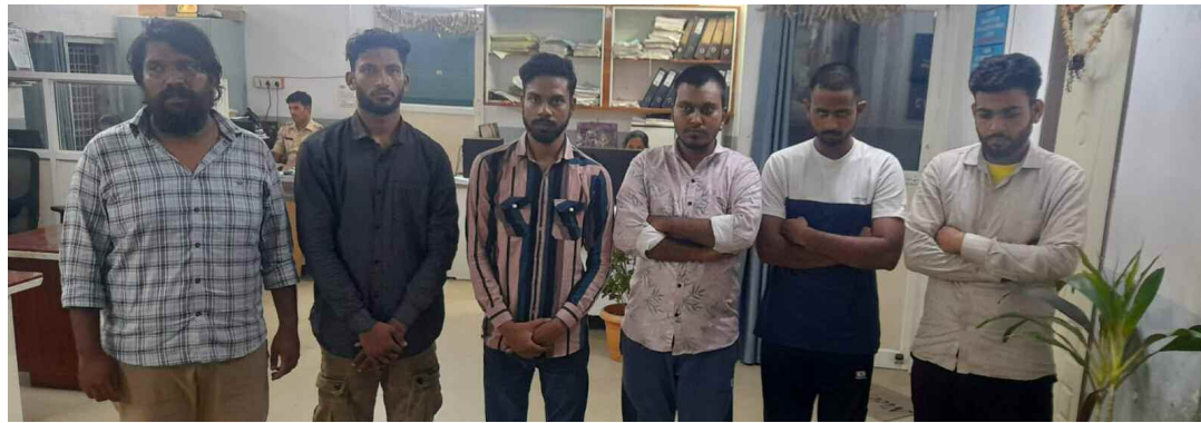
పోలీసులు అరెస్ట్ చేసిన నిందితులు

నిందితులను లిమాండ్కు తరలించిన అత్యాచార పోలీసులు బుద్వేల్, జూన్ 13 (ప్రభాత ఉదయం):