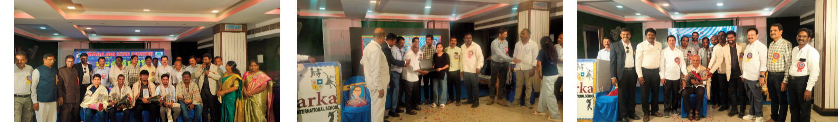
గ్రూప్ -1 అధికారులుగా నియమితులైన మందిగ యువత ను సన్మానిస్తున్న మాస్ ప్రతినిధులు, వివేక రంగాలలో ఉన్న మాదిగ ప్రముఖులు