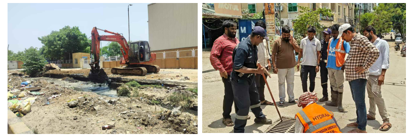
పిల్లర్ నెంబర్ 265 ట్రైక్ వద్ద మురుగు నీటి కాలువ ద్వారా డ్రైనేజీ నీరు సులభంగా వెళ్లడానికి ఎన్సఫ్ టెలిటర్ ద్వారా పనులు చేస్తున్న సిబ్బంది