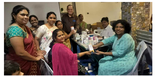
ఉచిత వైద్య శిబిరం లో పరీక్షలు నిర్వహించి మందులు పంపిణీ చేస్తున్న డాక్టర్లు, సిబ్బంది

వర్షాలకు రోడ్లపై నీరు నిలువ ఉండే ప్రాంతాల వద్ద జీహెచ్ఎంసీ ఇం జనీరింగ్ విభాగం సిబ్బంది, హైద్రా సిబ్బంది మంగళవారం పనులు చేపట్టారు. ఉప్పర్ పల్లి పిల్లర్ నెంబర్ 191 వద్ద పూడిక తీసిన మట్టిని, ఫోర్ట్స్ కాలనీ వద్ద పూడిక తీసి ఆ మట్టిని తొలగించారు. దీని వల్ల నీరు నిల్వకుండ ఉంటుందని సిబ్బంది తెలిపారు. పీడిపీ చౌరస్తా నుంచి జీవరాంపల్లి వెళ్లే మార్గంలో పిల్లర్ నెంబర్ 265 వద్ద గల జెస్ట్ ప్రైజ్ వద్ద మురుగునీటితో నిండి ఉన్న నాలు ను ఎన్సఫ్ టెలిటర్ సహాయంతో నాలులోకి వెళ్లే టన్ను చేశారు. గతంలో ఇక్కడ వర్షం నీరు నిల్వ ఉండటానికి నంబ్ కట్టిస్తున్నట్టి అది నిరుపయోగంగా మారింది. మురుగునీరు నిలచి ఓపెన్ నాలు గా మారడంతో ఎన్సఫ్ టెలిటర్ సహకారంతో ఆ నీరు వెళ్లి ఏర్పాటు చేశారు.