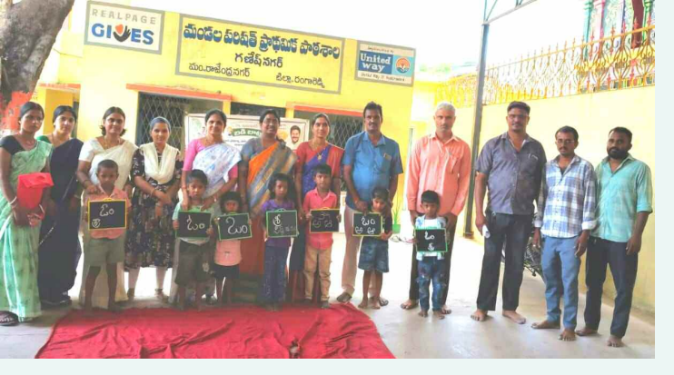
సామాహిక అక్షరాభ్యాసం లో పాల్గొన్న చిన్నారులు, ఉపాధ్యాయులు