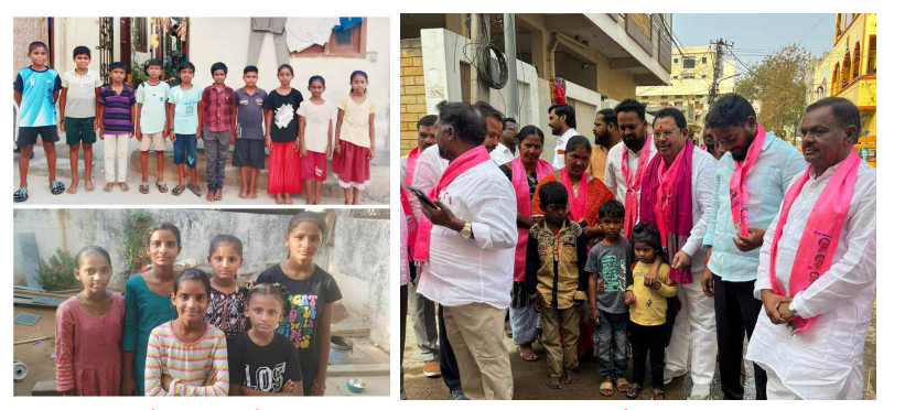
ప్రభుత్వ పాఠశాలలో 6వ తరగతిలో సీట్లు ధారకని విద్యార్థులు... చిన్నారులతో జి ఆర్ ఎస్ నాయకులు