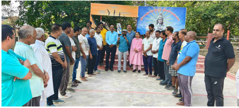
హెల్ప్ లైన్ 14416.. 24 గంటలు సేవలు..