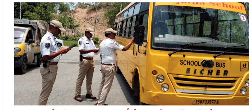
పైవేటు పాఠశాలల బస్సులను తనిఖీ చేస్తున్న రాజేంద్రనగర్ ట్రాఫిక్ పోలీసులు