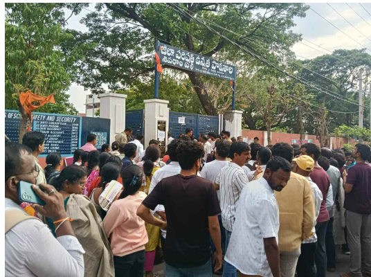
శివరాంపల్లి జిల్లా పరిషత్ ఉన్నత పాఠశాల వద్ద నీట్ పరీక్ష రాయడానికి వచ్చిన విద్యార్థులు

ఆలస్యంగా వచ్చి వెక్కి వెక్కి ఏడ్చిన విద్యార్థిని రాజేంద్రనగర్, జూన్ 21 (ప్రభాత ఉదయం):