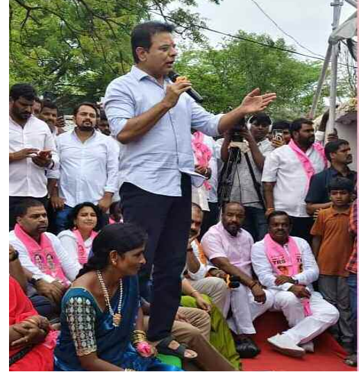
హనుమాన్ నగర్లో మాట్లాడుతున్న కే టీ ఆర్