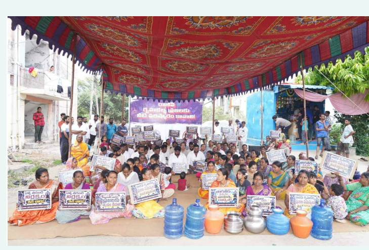
నీట్ కోసం ఖాళీ బండ్లతో నిరసన తెలుపుతున్న లక్ష్మీగూడ రాజీవ్ గృహ కల్ప నివాసులు

రాజేంద్రనగర్ లో సెంటర్ పడితే హయత్ నగర్ అని రాయడం ఏంటన్నారు. అలా రాయకుండా చూడాలన్నారు.