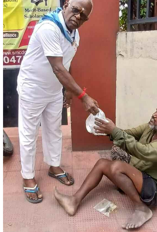
పృథ్విడి ఆహార ప్యాకెట్ల పంపిణీ