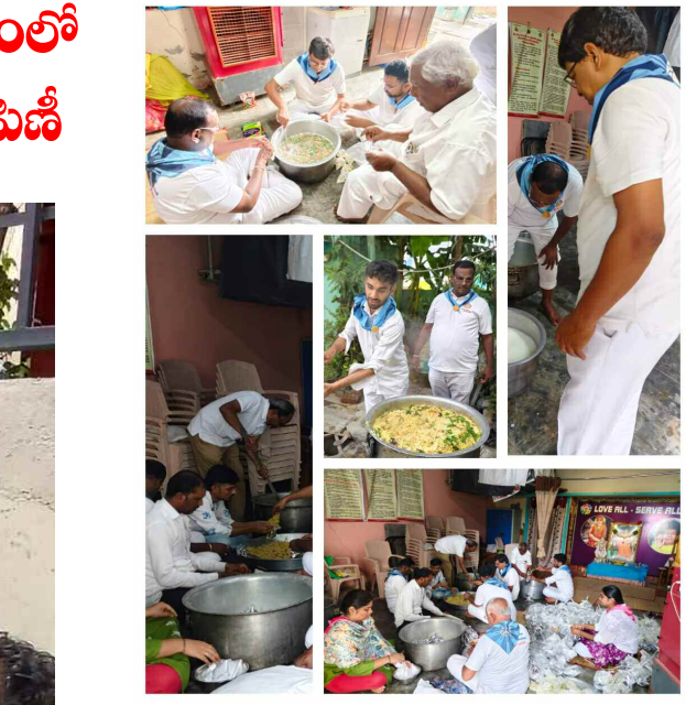
సేవా సమితి ఆధ్వర్యంలో తయారు చేస్తున్న ఉపహారాలు