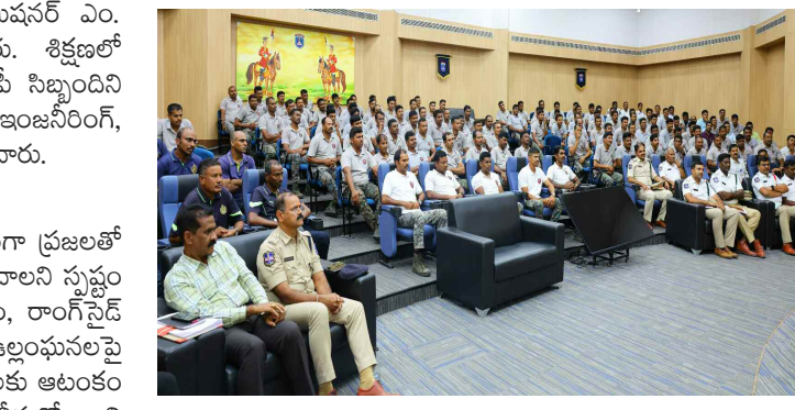
పిలుపునిచ్చారు. ఐటీ కారిడార్, వర్షాకాలంపై ప్రత్యేక శిక్షణ ఐటీ కారిడార్ ప్రాంతాల్లో ట్రాఫిక్ ఒత్తిడి అత్యధికంగా ఉంటుంది.

ఈ సమావేశంలో సీపీ మాట్లాడుతూ విధుల్లో భాగంగా ప్రజలతో అత్యంత మర్యాదపూర్వకంగా సేవాభావంతో వ్యవహరించాలని స్పష్టం చేశారు. హెల్మెట్ లోకపోవడం, లేని క్రమశిక్షణ తప్పడం, రాంగ్ సైడ్ డ్రైవింగ్, డ్రంక్ అండ్ డ్రైవ్ వంటి ప్రాణాంతక ఉల్లంఘనలపై కఠినంగా వ్యవహరించాలని ఆదేశించారు. ట్రాఫిక్ విధులకు ఆటంకం కలిగించే వారిపై చట్టప్రకారం కఠిన చర్యలు తీసుకోవాలని సూచించారు. రోడ్డు ప్రమాదాల వల్ల ఎన్నో కుటుంబాలు రోడ్డున వదులుతున్నాయని కేవలం చలానాలు వద్దించడమే కాకుండా, ప్రజల్లో బాధ్యతాయుతమైన డ్రైవింగ్ పై చైతన్యం తీసుకురావాలని సీపీ