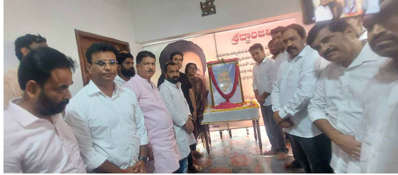
మాదాపూర్ పబ్ లు తనిఖీ చేస్తున్న ఫైర్ సేఫ్టీ అధికారుల ఫోటోలు...