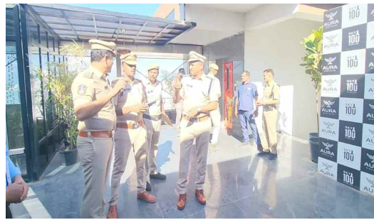
సమావేశాని హాజరైన గ్రేడ్సాఫ్ట్ సిబ్బంది.