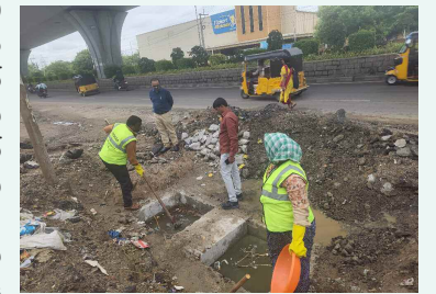
శివరాంపల్లి బస్టి ప్రజల వద్ద వరద నీరు వెళ్ళే మార్గం చూడే సు శుభ్రం చేస్తున్న సిబ్బంది