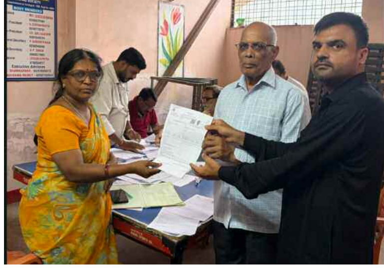
ఓటర్లకు ఎన్యూమరేషన్ దరఖాస్తు ఫారాలను అందజేస్తున్న నాయకులు