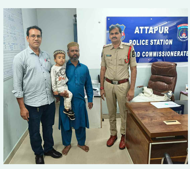
తప్పిపోయిన బాలుడి తండ్రి కి అప్పగించిన పోలీసులు