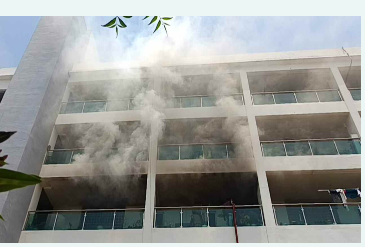
జన వ్రియ మార్కెట్ ఆఫ్ఫర్ మెంట్ మాడవ అంతస్తు లో పాగలు

విపరీతంగా పెరిగిపోయిన స్థానికులు వాపోతున్నారని తెలిపారు. ఈ మోడల్ మార్కెట్ చుట్టూ వ్యవసాయ విశ్వవిద్యాలయం, ఉద్యాన విశ్వవిద్యాలయం, పశువైద్య విశ్వవిద్యాలయంతో పాటు పలు కేంద్ర, రాష్ట్ర ప్రభుత్వ కార్యాలయాలు ఉన్నాయన్నారు. రోజూ వేలాది మంది విద్యార్థులు, ఉద్యోగులు ఇక్కడ రాకపోకలు సాగిస్తారన్నారు. ఈ మార్కెట్ తెరిస్తే వీరందరికీ ఎంతో మేలు జరుగుతుందన్నారు. ఉన్న అన్ని అడ్డంకులను తొలగించి మార్కెట్ను వెంటనే తెరవాలని, స్థానిక తోపుడు బండి వారు, కూరగాయల విక్రయదారులకు తక్కువ అద్దెల ఫ్యాషన్లు కేటాయించాలని, 9 ఏకర జాప్యానికి కారణమైన అధికారులపై విచారణ జరిపి చర్యలు తీసుకోవాలని, అధికారులు, ప్రజాప్రతినిధులు, వ్యాపారులతో కమిటీ చేసి పారదర్శకంగా నిర్వహించాలని డిమాండ్ చేశారు.