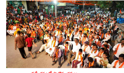
సమ్మేళనంలో పాల్గొన్న భక్తులు