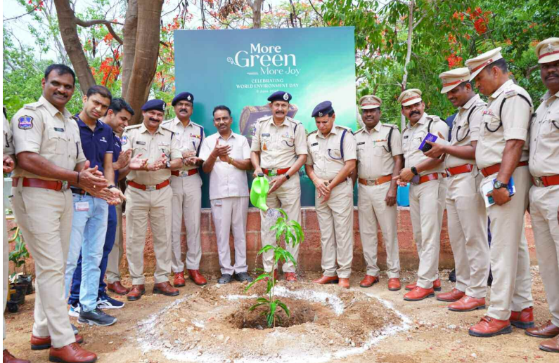
ప్రపంచ పర్యావరణ దినోత్సవాన్ని పురస్కరించుకొని కొండాపూర్ 8వ బెటాలియన్ లో మొక్కలు నాటుతున్న కామాండెంట్ ఇతర అధికారులు